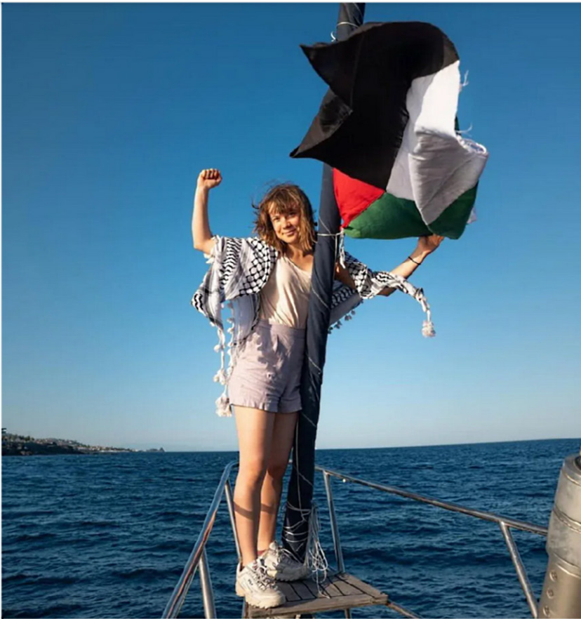
Mit Pali-Tuch und Palästina-Flagge segelte Greta Thunberg (22) Richtung Gaza

ner mittlerweile 22-Jährigen weniger berichtenswert sei als das Engagement eines frühreifen Teenagers. Vielmehr hätten ihre öffentlichen Positionierungen gegen Kapitalismus, Imperialismus und Israels Vorgehen in Gaza für Verärgerung gesorgt.