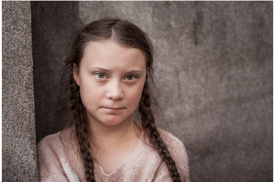
Greta Thunberg, 28.8.2018.