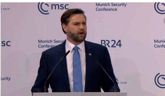
US-Vizepräsident J.D. Vance spricht auf der Münchener Sicherheitskonferenz. Diese Rede wird auch als Brandrede bezeichnet. (Screenshot vom 03.06.2025: < https://www.youtube.com/watch?v=pCOsgfINdKg >)

An die Damen und Herren Journalisten, welche über diese Ungeheuerlichkeit nicht berichten, sei gesagt, dass sie damit Unrecht Vorschub leisten, wohl um den Mächtigen nicht auf die Zehen zu stehen oder Werbekunden nicht zu vergraulen – oder beides. Ihnen scheint die Existenz zweier Berufskollegen ein akzeptabler Preis für Ihr Schweigen zu sein – schämen Sie sich!