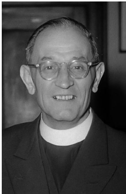
Martin Niemöller