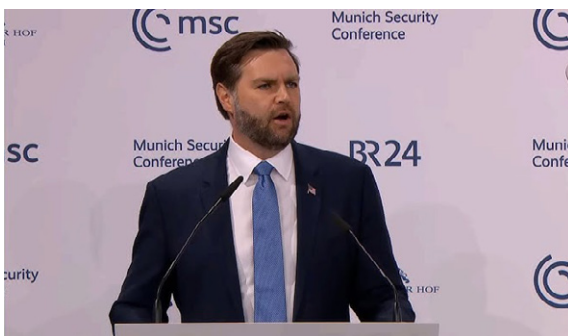
US-Vizepräsident J.D. Vance spricht auf der Münchener Sicherheitskonferenz. Diese Rede wird auch als Brandrede bezeichnet.

An die Damen und Herren Journalisten, welche über diese Ungeheuerlichkeit nicht berichten, sei gesagt, dass sie damit Unrecht Vorschub leisten, wohl um den Mächtigen nicht auf die Zehen zu stehen oder Werbekunden nicht zu vergraulen – oder beides. Ihnen scheint die Existenz zweier Berufskollegen ein akzeptabler Preis für Ihr Schweigen zu sein – schämen Sie sich!