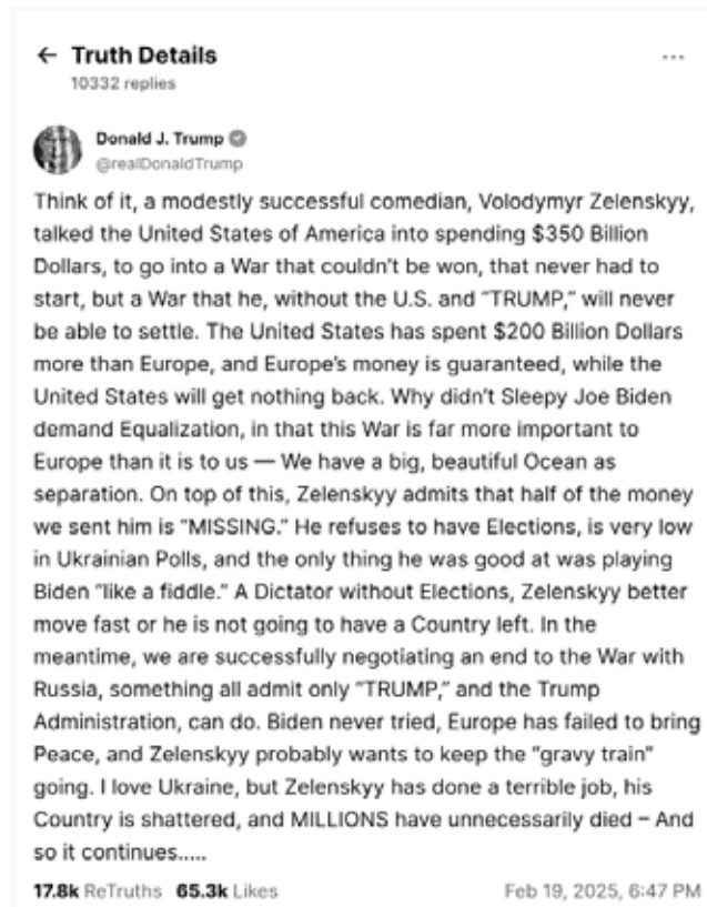
Donald Trump via Truth Social. (Quelle: < https://truthsocial.com/@realDonaldTrump/posts/114031332924234939 >)

Im Januar 2024 fanden verschiedene Sitzungen nach der Arria-Formel statt. Am 13. Januar 2024 berief das Vereinigte Königreich – mit Unterstüt-