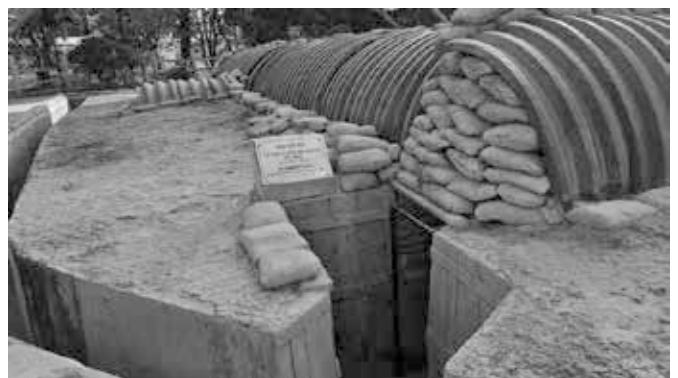
Der Bunker des französischen Kommandanten Christian de Castries in Điện Biên Phủ.