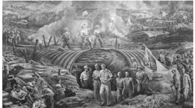
Gemälde, das die Kapitulation der Franzosen darstellt.

Er war weitgehend Autodidakt in der Kriegskunst und trat in den 1940er Jahren als beeindruckender Guerillaführer in Erscheinung. In den 1950er Jahren beherrschte er sowohl die irreguläre als auch die konventionelle Kriegsführung. Seine Strategien, die er in jahrelangen Konflikten verfeinert hat, sind nach wie vor Teil der militärischen Lehrpläne auf der ganzen Welt.