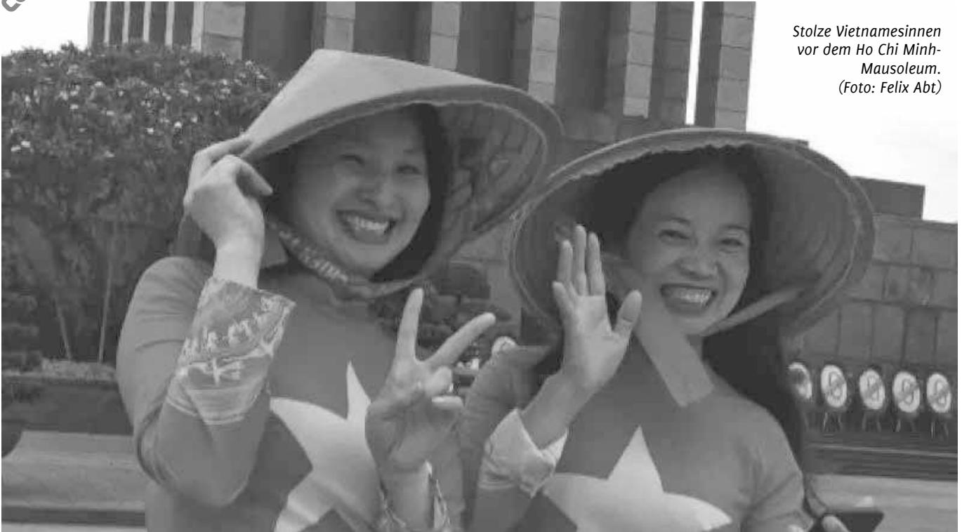
Stolze Vietnamesinnen vor dem Ho Chi Minh- Mausoleum.