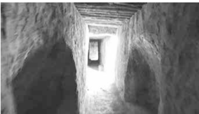
Teil eines ausgeklügelten Tunnelsystems in der Nähe der französischen Verteidigungslinien, gebaut von den Viet Minh.

Giáp war für seine intellektuelle Strenge bekannt und wurde von seinen Klassenkameraden als außergewöhnlich begabt in Erinnerung behalten. Er verschlang militärische Texte – von klassischen chinesischen Strategien und französischen Feldzügen bis hin zu vietnamesischen Kriegstraditionen.