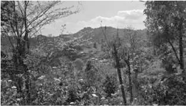
Das schwer erreichbare Điện Biên Phủ.

hielt das französische Militär Điện Biên Phủ für uneinnehmbar. Im Vertrauen auf ihre Luftüberlegenheit und ihre befestigten Stellungen wollten sie die Viet Minh in einen offenen Kampf locken und sie mit ihrer überlegenen Feuerkraft überwältigen. Diese Selbstüberschätzung sollte ihnen jedoch zum Verhängnis werden.