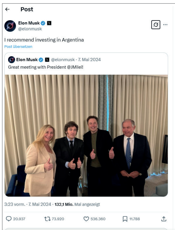
Elon Musk traf sich persönlich mit Javier Milei und empfahl danach in Argentinien zu investieren. (Screenshot vom 26.03.2025; X, < https://x.com/elonmusk/status/1787654457339342932 >)

In seiner Rolle bei DOGE verfolgt Musk einen ganz ähnlichen Ansatz wie Milei. Anfang dieses Monats schickte der in Südaf-