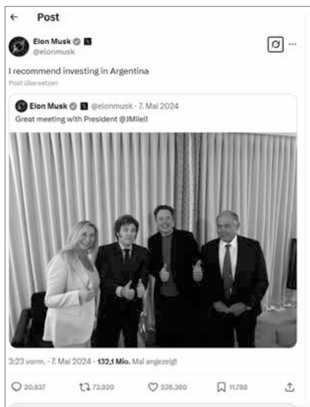
Elon Musk traf sich persönlich mit Javier Milei und empfahl danach in Argentinien zu investieren. (Screenshot vom 26.03.2025: X, < https://x.com/elonmusk/status/1787654457339342932 >)

In seiner Rolle bei DOGE verfolgt Musk einen ganz ähnlichen Ansatz wie Milei. Anfang dieses Monats schickte der in Südaf-