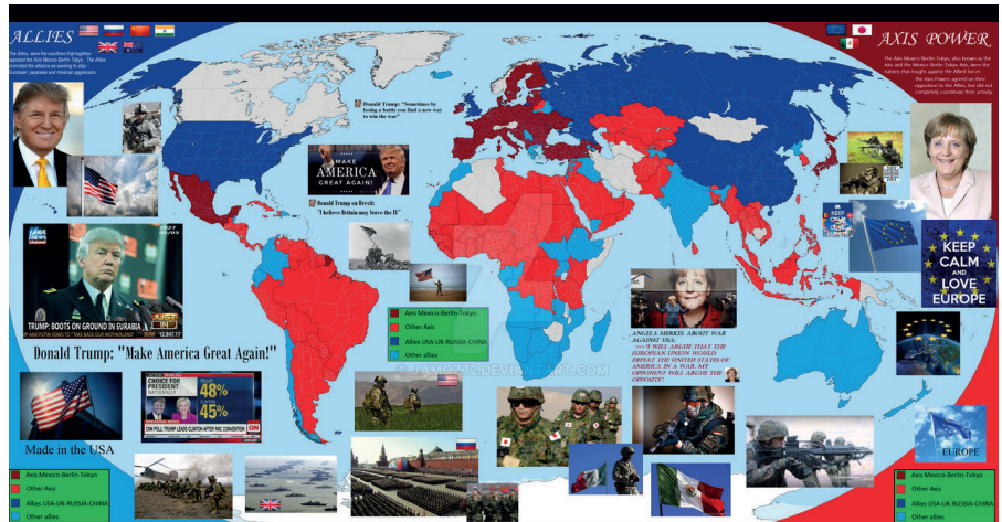
Zukunftskarte USA vs. Europa von Schrödinger Excidium-d