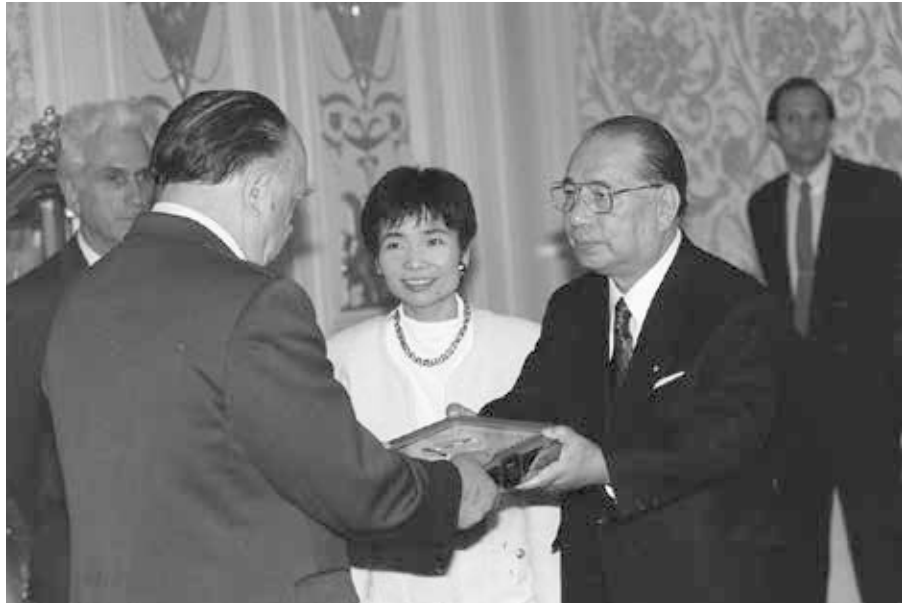
Der Philosoph Daisaku Ikeda bei einer Verleihung eines Preises durch den engen Berater von Gorbatschow Alexander Nikolajewitsch Jakowlew, der als Initiator der Reformpolitik, der Perestrojka, gilt. In den Neunziger Jahren des vorigen Jahrhunderts trat er in einen intensiven Dialog mit dem ehemaligen sowjetischen Präsidenten Michail Gorbatschow. 1998 veröffentlichten beide den nach wie vor lesenswerten Band „Unsere Wege treffen sich am Horizont“.

· Michail Sergejewitsch, mit Ihrer Person hat das Neue Denken, das von Intellektuellen wie Albert Einstein, Bertrand Russell und Günther Anders über Jahrzehnte vorbereitet worden war, erstmals die Ebene der Weltpolitik erreicht. Mich hat, als ich Ihr Buch „Unsere Wege treffen sich am Horizont“ las, das Sie Ende der Neunziger Jahre zusammen mit dem japanischen buddhistischen Philosophen Daisaku Ikeda veröffentlicht haben, der Gedanke sehr angerührt, dass es Anfang der Achtzi-