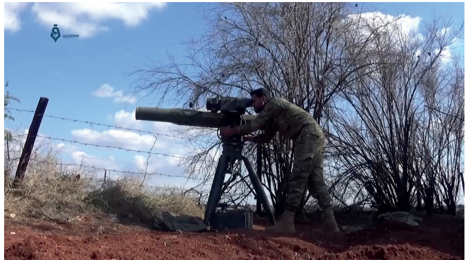
Ein Rebellenkämpfer der „Armee des Ruhmes“ feuert eine BGM-71 TOW-Panzerabwehrrakete auf Stellungen der syrischen Regierung in der Landschaft nördlich von Hama, 24.3.2017.

So seltsam es auch erscheinen mag, hat die CIA wiederholt islamistische Dschihadisten unterstützt, um diese Kriege zu führen, und Dschihadisten haben gerade das syrische Regime gestürzt. Schließlich hat die CIA durch die Ausbildung, Bewaffnung und Finanzierung der Mudschaheddin in Afghanistan ab Ende der 1970er Jahre dazu beigetragen, Al-Qaida überhaupt erst zu schaffen. Ja, Osama bin Laden wandte sich später gegen die USA, aber seine Bewegung war dennoch