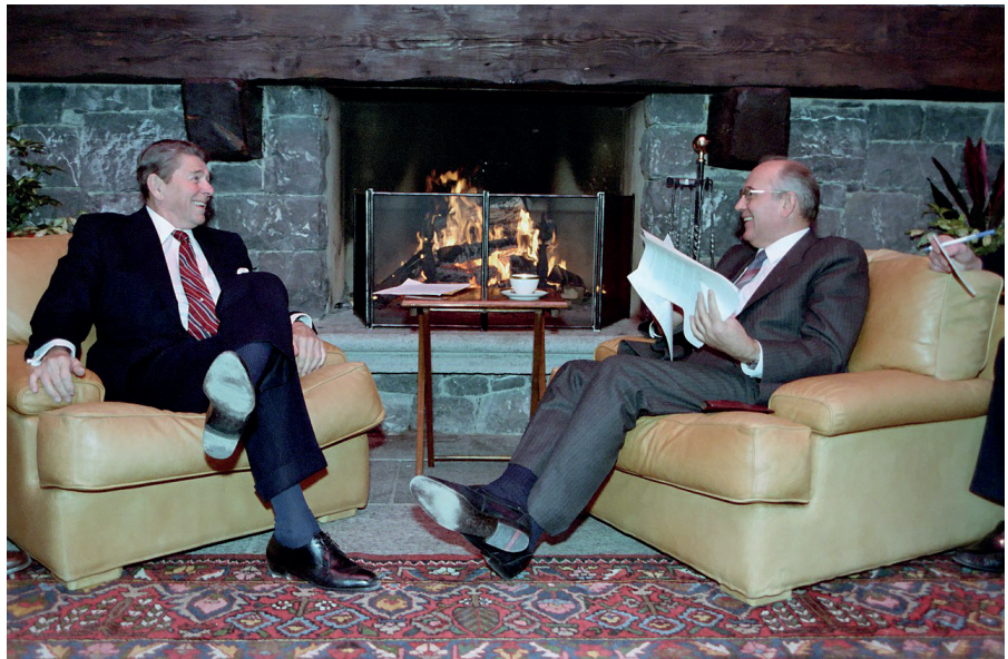
Präsident Ronald Reagan und der sowjetische Generalsekretär Michail Gorbatschow beim ersten Gipfeltreffen in Genf, Schweiz, 19.11.1985.