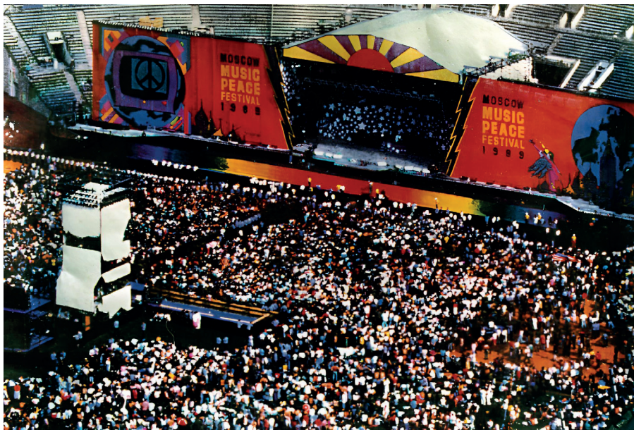
„Russisches Woodstock“: Die Bühne beim Moscow Music Peace Festival 1989 war imposant. Die gesamte Technik war aus der Bundesrepublik und Großbritannien herangekarrt worden. Insgesamt 55 Sattelschlepper waren dafür nötig. Das Ziel der Veranstalter: 20 Jahre nach Woodstock sollte auch das sowjetische Pendant im Moskauer Luschniki-Stadion ein pophistorischer Meilenstein werden, 1.8.1989.

Ausgehend von der Tatsache, „dass die Menschheit zum ersten Mal in ihrer Geschichte sterblich geworden ist und der Charakter der modernen Waffen keinem Staat mehr Hoffnung lässt, sich allein mit