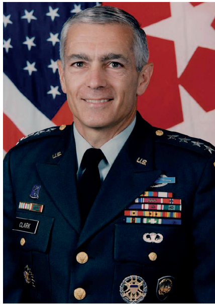
General Wesley Clark

Kein Staat auf dieser Liste hatte irgendeine offensichtliche Verbindung zu den Ereignissen des 11. Septembers. Ein Staat, der solche Verbindungen aufwies – Saudi Arabien – befand sich nicht auf der Liste und blieb einer der beliebtesten Klientelstaaten der Vereinigten Staaten.