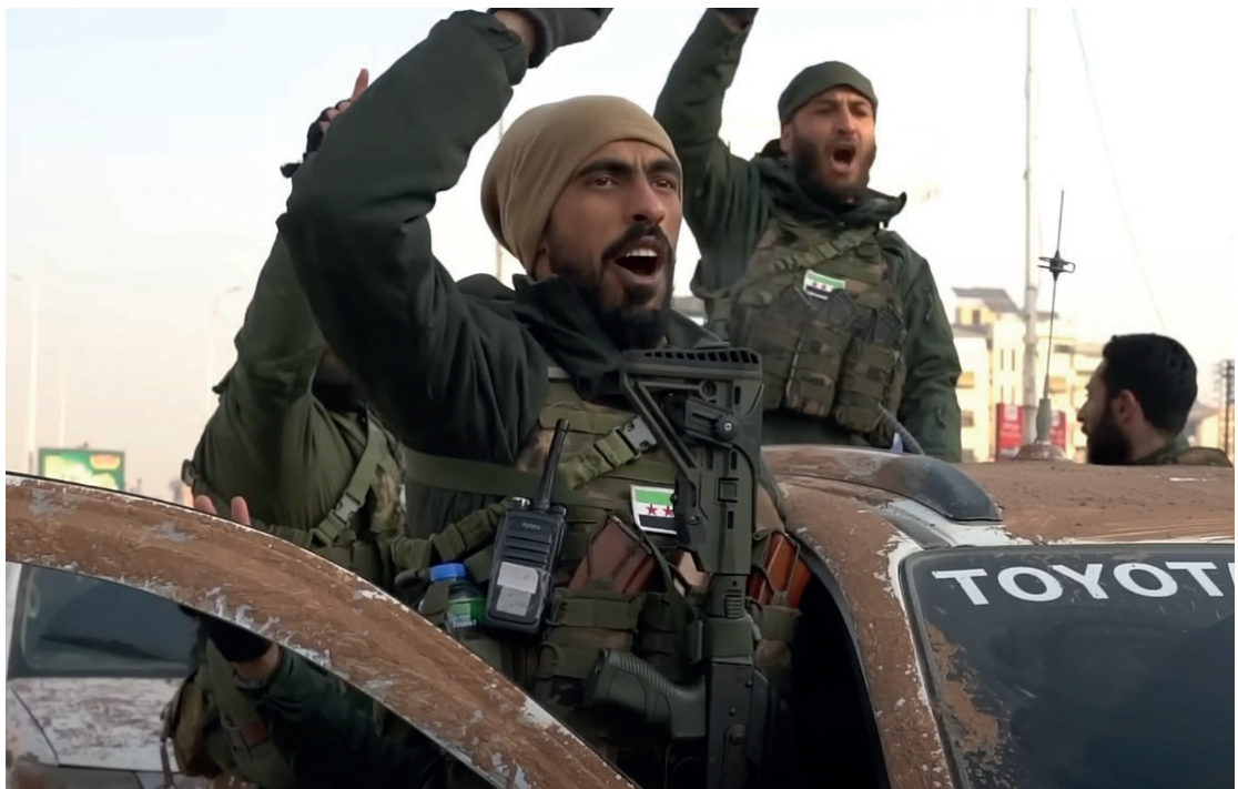
HTS-Rebellen nehmen die Stadt Hama ein. 8.12.2024

Letztendlich verhärteten sich die Fronten zu einer Patt-Situation.