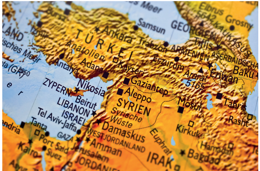
Syrien und Nachbarstaaten

Dieser Text wurde zuerst am 11.12.2024 auf www.jonathan-cook.net unter der URL https://www.jonathan-cook.net/2024-12-11/syria-assad-pentagon-plan/ veröffentlicht. Lizenz: Jonathan Cook, Middle East Eye