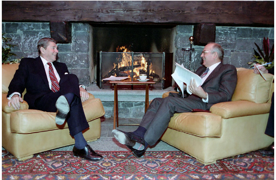
Präsident Ronald Reagan und der sowjetische Generalsekretär Michail Gorbatschow beim ersten Gipfeltreffen in Genf, Schweiz, 19.11.1985.