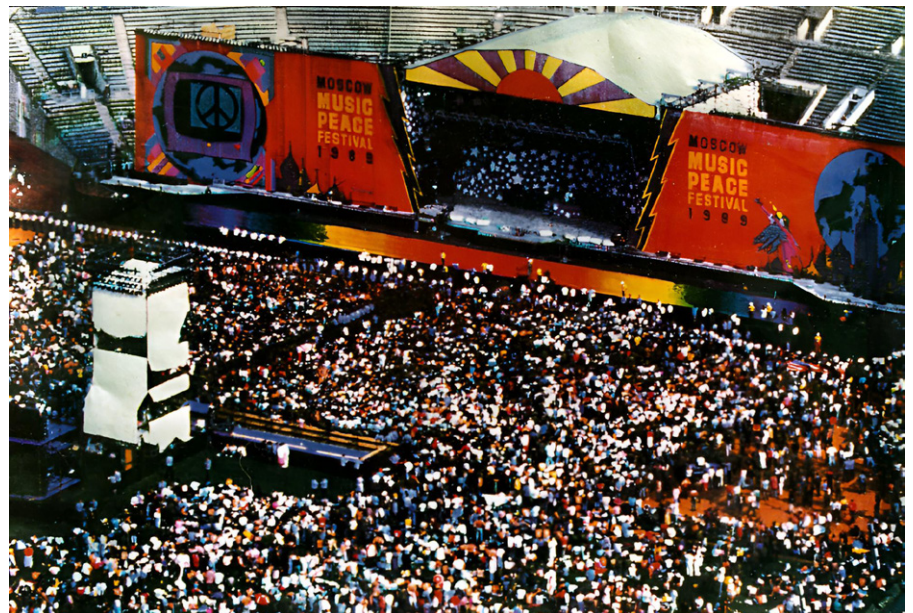
„Russisches Woodstock“: Die Bühne beim Moscow Music Peace Festival 1989 war imposant. Die gesamte Technik war aus der Bundesrepublik und Großbritannien herangekarrt worden. Insgesamt 55 Sattelschlepper waren dafür nötig. Das Ziel der Veranstalter: 20 Jahre nach Woodstock sollte auch das sowjetische Pendant im Moskauer Luschniki-Stadion ein pophistorischer Meilenstein werden, 1.8.1989.

Ausgehend von der Tatsache, „dass die Menschheit zum ersten Mal in ihrer Geschichte sterblich geworden ist und der Charakter der modernen Waffen keinem Staat mehr Hoffnung lässt, sich allein mit