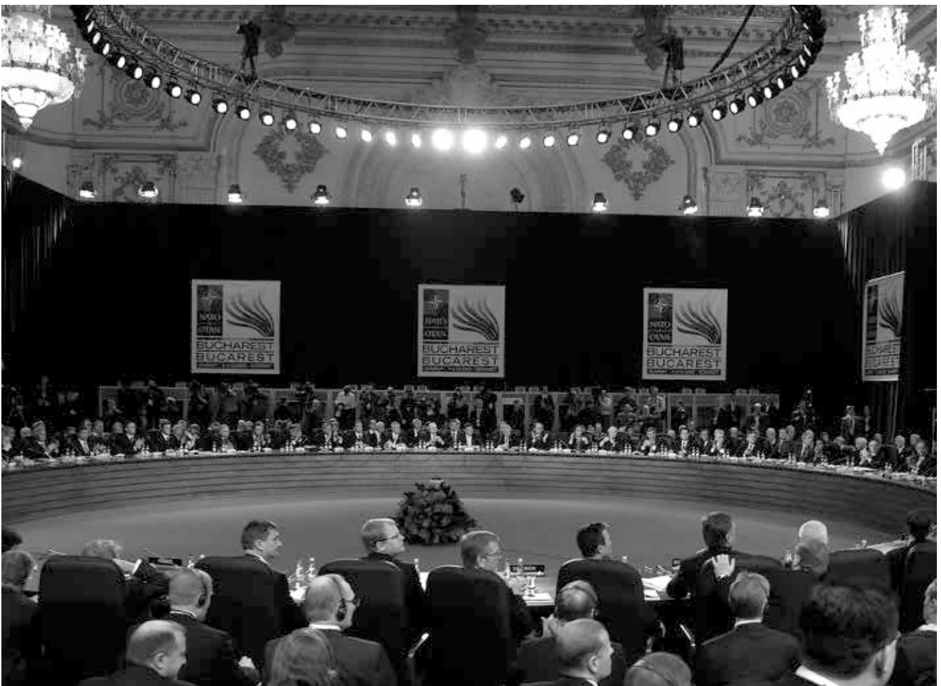
NATO-Verteidigungsminister und andere Staats- und Regierungschefs der Welt treffen sich in Bukarest, Rumänien, zu einem dreitägigen Gipfeltreffen, um neue Erweiterungen der NATO zu diskutieren, 3. April 2008.

Um noch einen Schritt weiter zu gehen: Zahlreiche amerikanische Politiker und Strategen sprachen sich in den 1990er Jahren gegen die Entscheidung von Präsident Clinton aus, die NATO zu erweitern, als diese Entscheidung noch zur Debatte stand. Diesen Gegnern war von Anfang an klar, dass die russische Führung darin eine Bedrohung ihrer lebenswichtigen Interessen sehen würde und dass diese Politik letztlich in eine Katastrophe münden würde. Die Liste der Gegner umfasst prominente Persönlichkeiten des Establishments wie George Kennan, sowohl Präsident Clintons Verteidigungsminister William Perry als auch seinen Vorsitzenden des Vereinigten General-