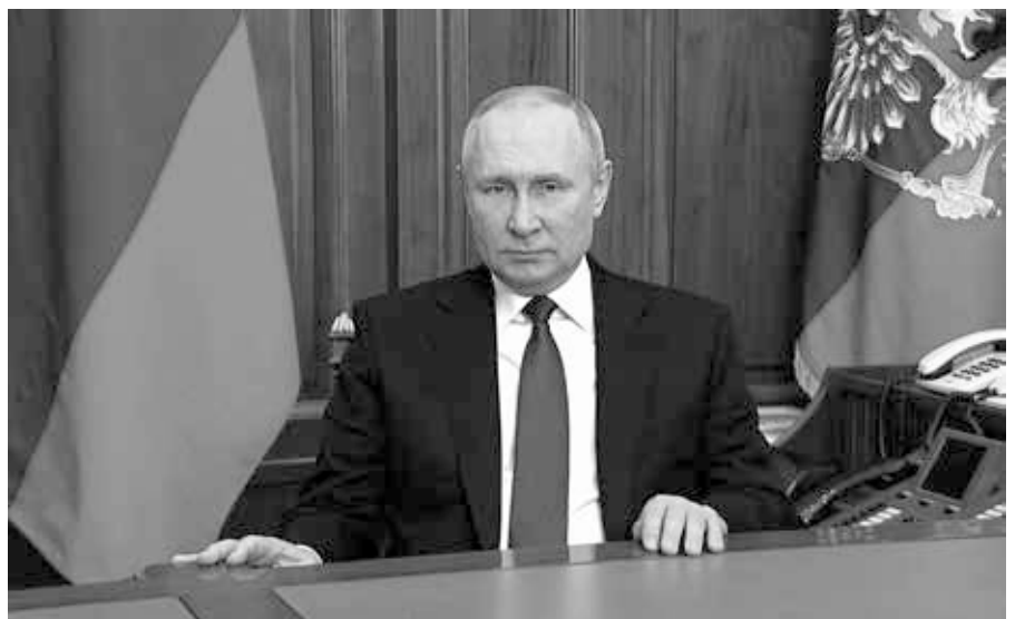
Präsident der Russischen Föderation Wladimir Putin während der Rede „Über die Durchführung einer besonderen Militäroperation“ am 24. Februar 2022.

Wenn man sie zu diesem Punkt befragt, liefern die Verfechter der konventionellen Meinung Hinweise, die wenig oder gar nichts mit Putins Motiven für die Invasion der Ukraine zu tun haben. Einige betonen zum Beispiel, dass er sagte, die Ukraine sei ein "künstlicher Staat" oder kein "echter Staat". Solche undurchsichtigen Äußerungen sagen jedoch nichts über die Gründe für seinen Kriegseintritt aus. Dasselbe gilt für Putins Aussage, er betrachte Russen und Ukrainer als "ein Volk" mit einer gemeinsamen Geschichte. Andere weisen darauf hin, dass er den Zusammenbruch der Sowjetunion als "die größte geopolitische Katastrophe des Jahrhunderts" bezeichnete. Aber Putin sagte auch: "Wer die Sowjetunion nicht vermisst, hat kein Herz. Wer sie zurückhaben will, hat kein Hirn." Andere wiederum verweisen auf eine Rede, in der er erklärte: "Die moderne Ukraine wurde vollständig von Russland geschaffen, genauer gesagt, vom bolschewistischen, kommunistischen Russland."