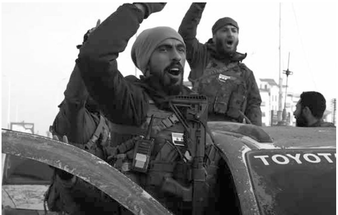
HTS-Rebellen nehmen die Stadt Hama ein. 8.12.2024

Letztendlich verhärteten sich die Fronten zu einer Patt-Situation.