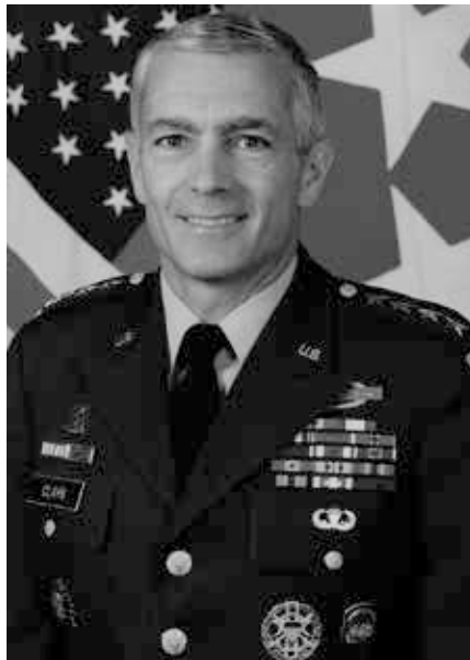
General Wesley Clark

Kein Staat auf dieser Liste hatte irgendeine offensichtliche Verbindung zu den Ereignissen des 11. Septembers. Ein Staat, der solche Verbindungen aufwies – Saudi Arabien – befand sich nicht auf der Liste und blieb einer der beliebtesten Klientel-Staaten der Vereinigten Staaten.