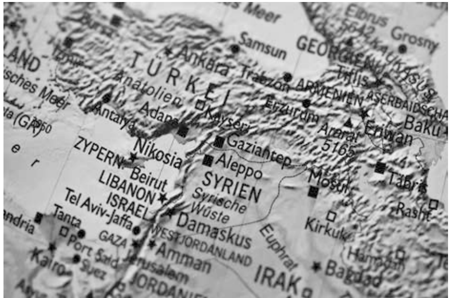
Syrien und Nachbarstaaten

Dieser Text wurde zuerst am 11.12.2024 auf www.jonathan-cook.net unter der URL https://www.jonathan-cook.net/2024-12-11/syria-assad-pentagon-plan/ veröffentlicht. Lizenz: Jonathan Cook, Middle East Eye