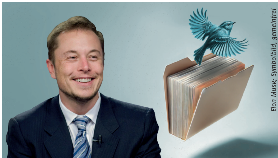
Elon Musk; Symbolbild, gemeinfrei

Während des Krieges gegen den Populismus und der Phase der Einschüchterung durch die Einführung des Neuen Normalen Reiches fungierten Twitter, Inc. und jede andere Social-Media-Plattform und Massenmedien in der westlichen Welt als Wahrheitsministerium des Imperiums, verbreiteten offizielle Propaganda des Neuen Normal, zensurierten abweichende Meinungen und löschten die Online-Identität aller, die die offiziellen Narrative des Imperiums in Frage stell-