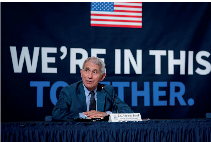
Dr. Anthony Fauci