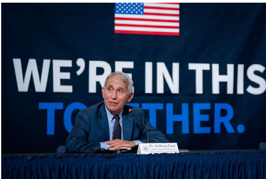
Dr. Anthony Fauci, Public Domain 1.0