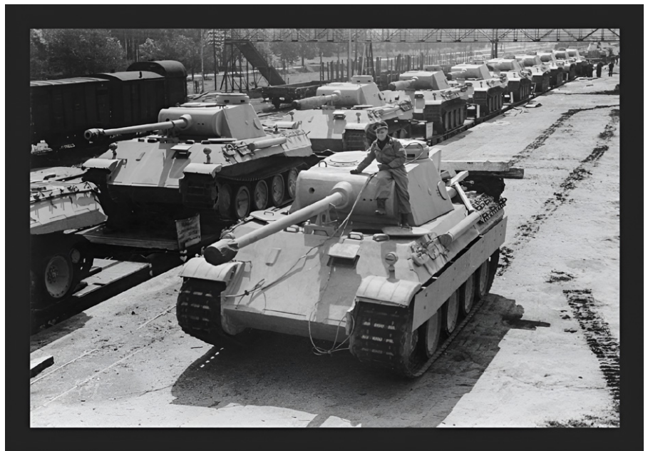
Der von der faschistischen deutschen Wehrmacht während des Krieges entwickelte neue Panzerkampfwagen Typ "Panther". UBz: die Verladung neuer "Panther"-Panzerkampfwagen zum Transport an die Front, 1943.

Über die Jahrhunderte hat Russland verschiedene Attacken auf ihre verwundbare Flanke im Westen erlebt. Und in der jüngeren Geschichte durch Napoleon und Hitler. Es ist keine Überraschung, dass Russen in Bezug auf diese blutige Geschichte sehr empfindlich sind. Haben Bill Burns et al das durchdacht? Haben sie geglaubt, dass Putin sich durch einen Einmarsch der NATO in Russland „herausgefordert“ fühlen würde, und dass er bei einem weiteren Vorstoß einknicken und einem „eingefrorenen“ Ausgang in der Ukraine zustimmen würde – mit dem Beitritt der Ukraine zur NATO? Vielleicht haben sie das.