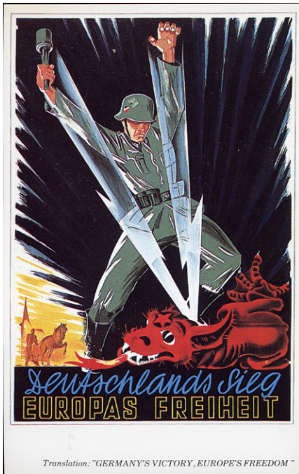
Postkartenversion eines NSDAP Kriegsplakats 1941: Das Plakat zeigt einen deutschen Soldaten, der mit 2 Blitzen einen roten Drachen mit dem kommunistischen Stern auf der Stirn überwindet. Im Hintergrund pflügt ein Bauer mit seinem Pferd.

Letztlich war die Botschaft, die westliche Dienste gesendet haben, dass der Westen (NATO) nach Russland kommt. Das ist der Sinn der bewussten Entscheidung für Kursk. Zwischen den Zeilen von Bill Burns Botschaft zu lesen, heißt, sich auf einen Krieg mit der NATO vorzubereiten.