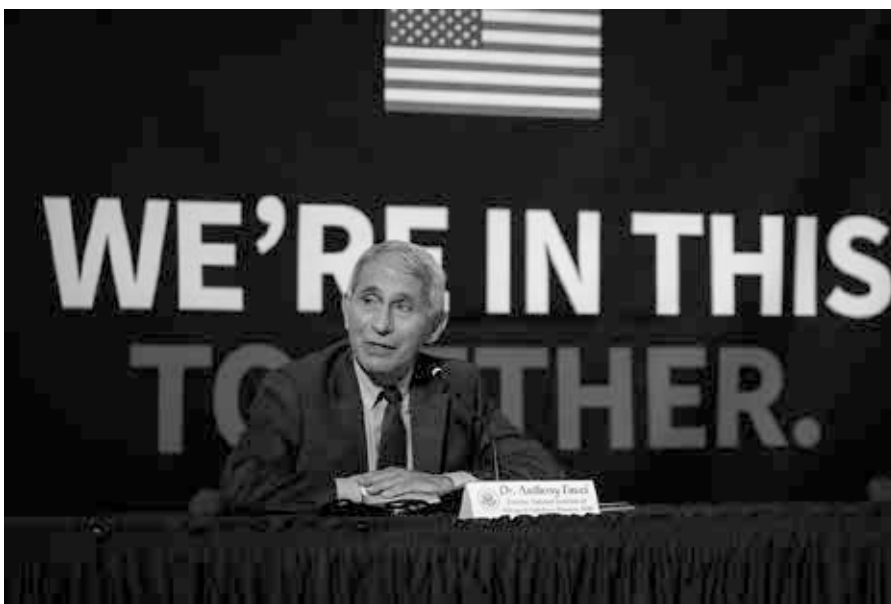
Dr. Anthony Fauci