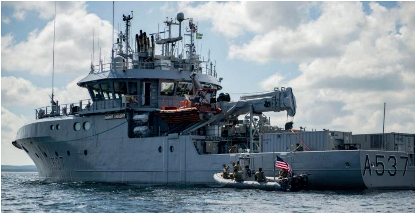
Ostsee (8. Juni 2022). U.S. Marine-Angehörige von der Explosive Ordnance Disposal Mobile Unit (EODMU) 8 nähert sich der Magnus Lagabøte (A 537), Ein Schiff der Reine Klasse. In dem Container an Bord ist möglicherweise eine mobile Dekompressionskammer, die zum Tiefseetauchen benötigt wird. Siehe: [8, 9]

sagte eine von Hersh's Quellen. Um lokale Probleme in Europa zu bewältigen, habe sich die Gruppe an Norwegen gewandt, sagte er.