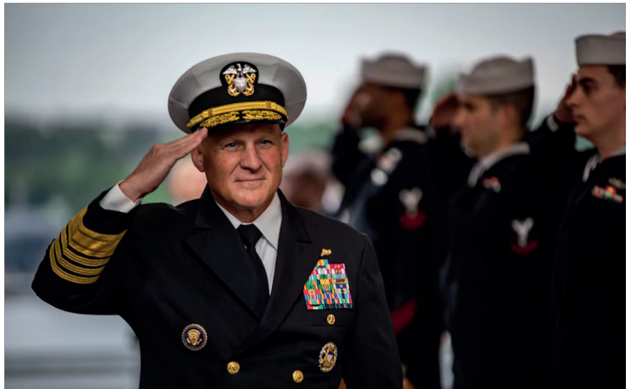
Admiral Mike Gilday, Leiter der Marineoperationen, am 17. Juni 2022 in Kiel bei der Übung BALTOPS-22. Er übernahm die Führung auf dem Kommando- und Kontrollschiff USS Mount Whitney. Siehe: [14]

Dieser Text wurde zuerst am 24.07.2024 auf www.olatunander.substack.com unter der URL https://olatunander.substack.com/p/were-the-us-navy-deep-divers-at-the veröffentlicht. Lizenz: Ola Tunander, Free21, CC BY-NC-ND 4.0