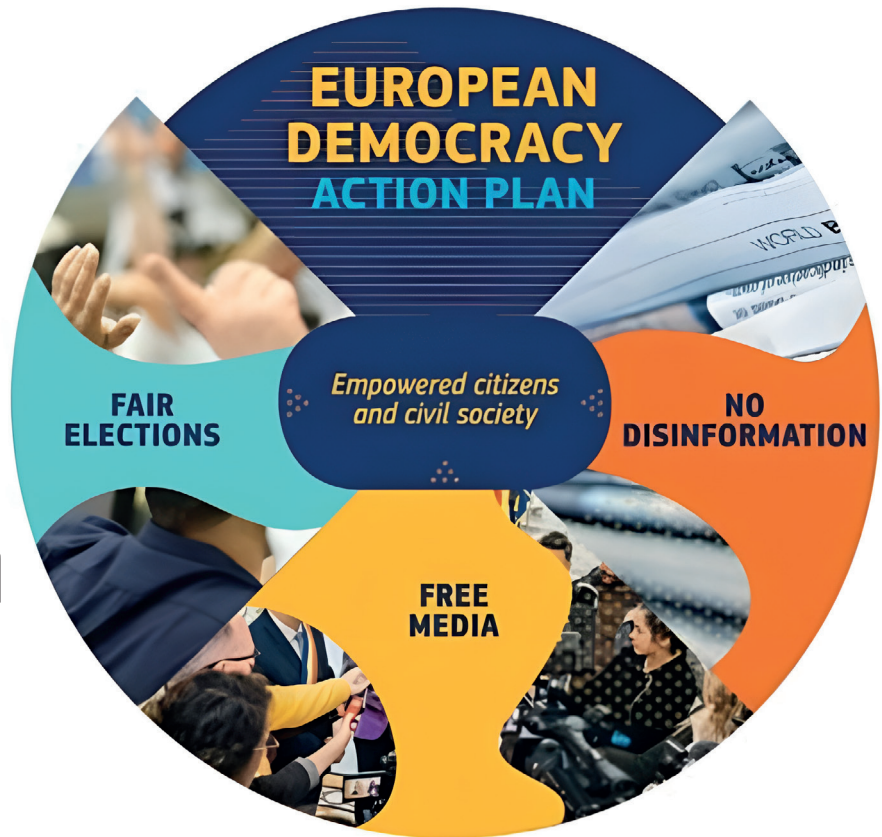
erstellt am 24.7.2024 - 12:43:25, https://commission.europa.eu/strategy-and-policy/priorities-2019-2024/new-push-european-democracy/protecting-democracy_de