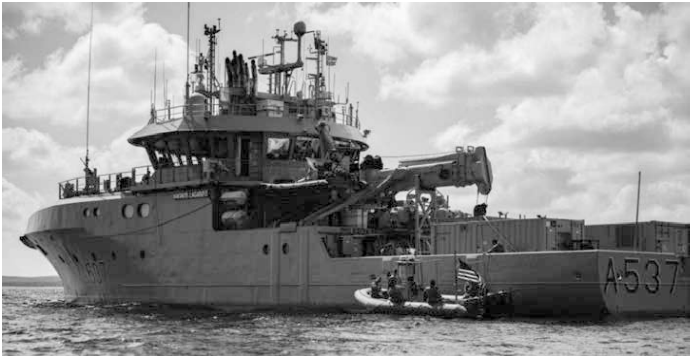
Ostsee (8. Juni 2022). U.S. Marine-Angehörige von der Explosive Ordnance Disposal Mobile Unit (EODMU) 8 nähert sich der Magnus Lagabøte (A 537), Ein Schiff der Reine Klasse. In dem Container an Bord ist möglicherweise eine mobile Dekompressionskammer, die zum Tiefseetauchen benötigt wird. Siehe: [8, 9]

sagte eine von Hersh's Quellen. Um lokale Probleme in Europa zu bewältigen, habe sich die Gruppe an Norwegen gewandt, sagte er.