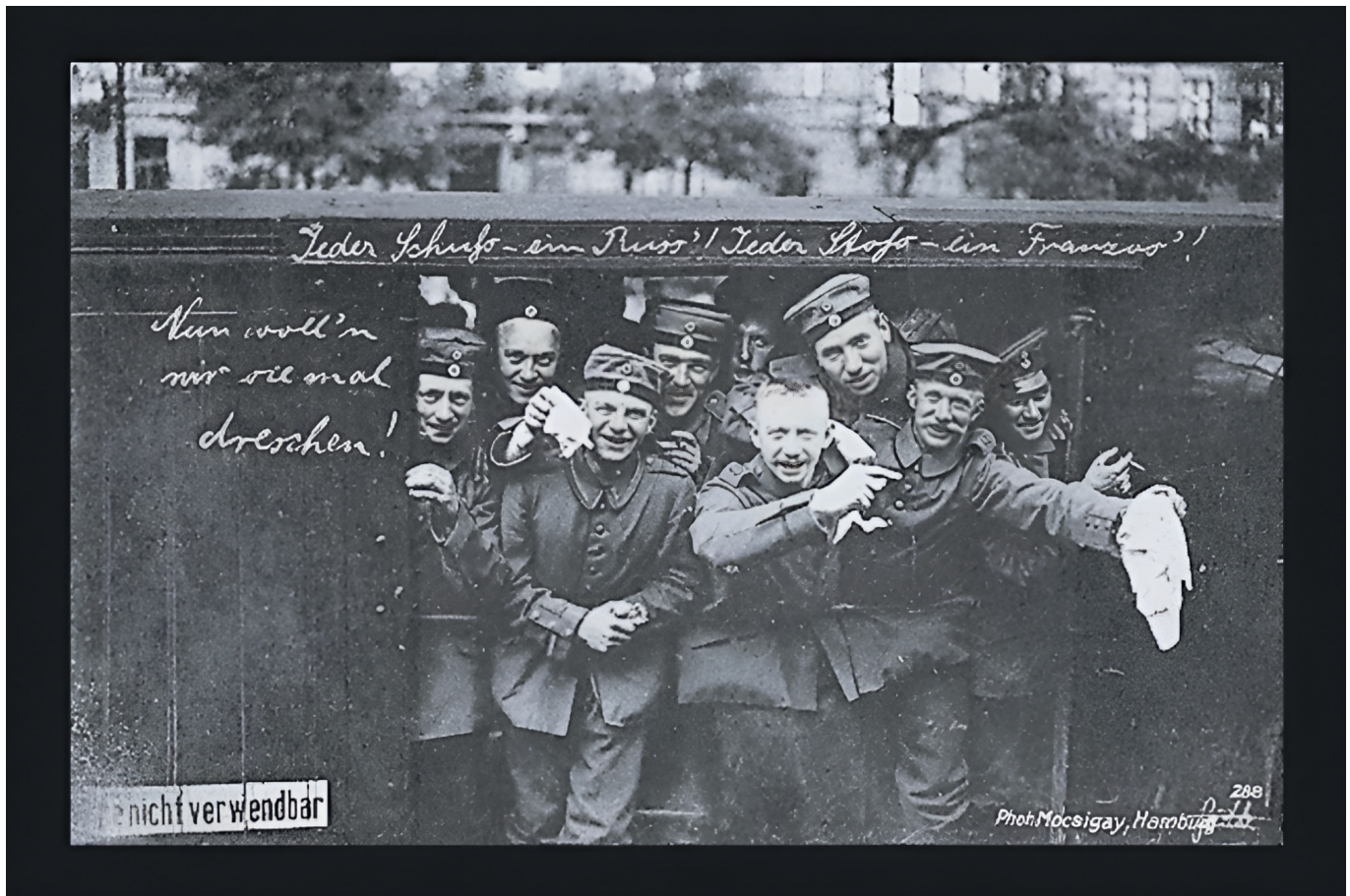
Wohlfahrts-Karte des Vaterländischen Frauenvereins, Provinzialvereins Berlin zum Besten der Kriegsfürsorge, etwa 1914.

Es war noch keine Panik, aber doch eine ständig schwelende Unruhe; immer fühlten wir ein leises Unbehagen, wenn vom Balkan her die Schüsse knatterten. Sollte wirklich der Krieg uns überfallen, ohne dass wir es wussten, warum und wozu? Langsam – allzu langsam, allzu zaghaft, wie wir heute wissen! – sammelten sich die Gegenkräfte. Die Haltung der meisten Intellektuellen war leider eine gleichgültig passive, denn dank