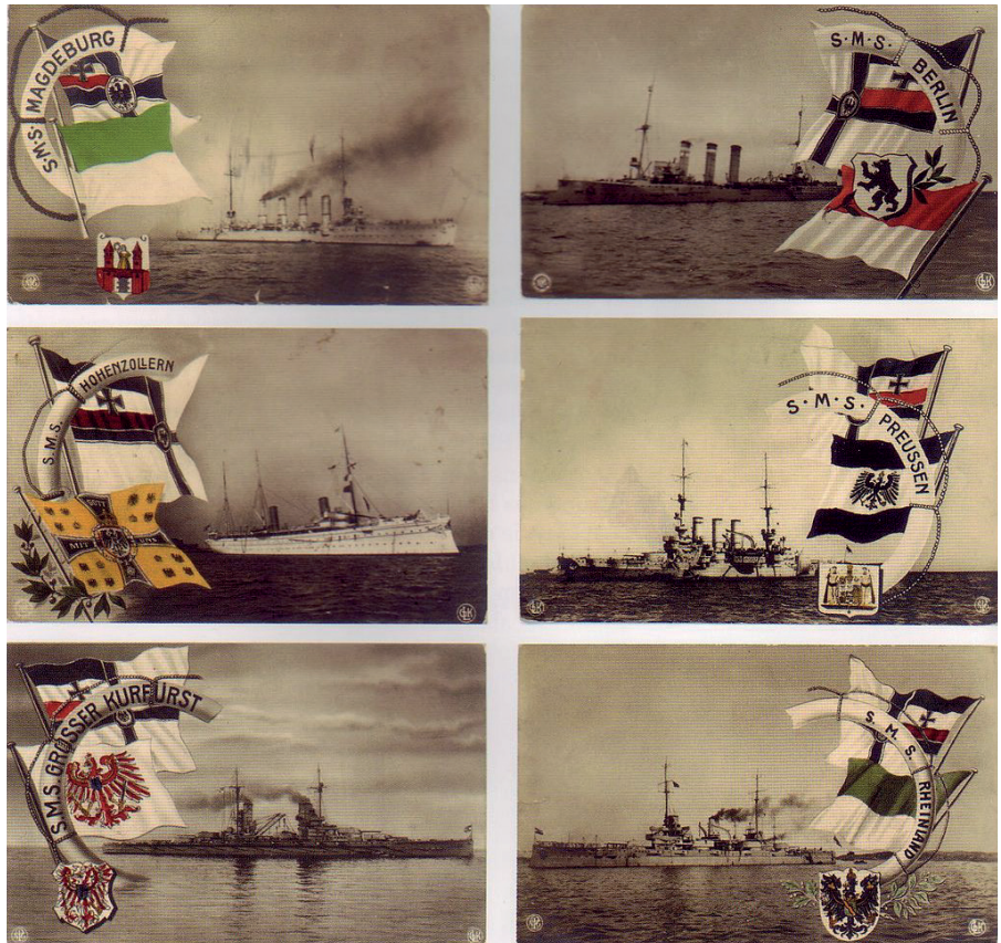
Schiffe der Kaiserlichen Marine: Magdeburg, Berlin, Hohenzollern, Preußen, Großer Kurfürst und Rheinland, etwa 1910.

Vierzig Jahre Frieden hatten den wirtschaftlichen Organismus der Länder gekräftigt, die Technik den Rhythmus des Lebens beschwingt, die wissenschaftlichen Entdeckungen den Geist jener Generation stolz gemacht; ein Aufschwung begann, der in allen Ländern unseres Europas fast gleichmäßig zu fühlen war. Die Städte wurden schöner und volkreicher von Jahr zu Jahr, das Berlin von 1905 glich nicht mehr jenem, das ich 1901 gekannt, aus der Residenzstadt war eine Weltstadt geworden und war schon wieder großartig überholt von dem Berlin von 1910. Wien, Mailand, Paris, London, Amsterdam – wann immer man wiederkam, war man erstaunt und beglückt; breiter, prunkvoller wurden die Straßen, machtvoller die öffentlichen Bauten, luxuriöser und geschmackvoller die Geschäfte. Man spürte es an allen Dingen, wie der Reich-