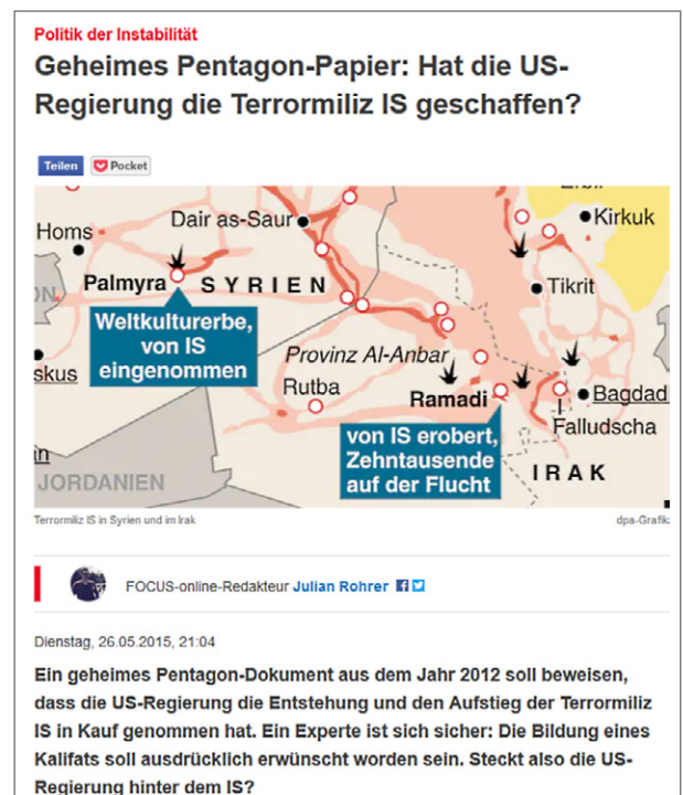
Screenshot: Focus, erstellt am 28.5.2024 - 13:06:15, https://www.focus.de/politik/ausland/krise-in-der-arabischen-welt/politik-der-instabilitaet-geheim-es-pentagon-papier-hat-die-us-regierung-die-terrormiliz-is-geschaffen_id_4707070.html

Wenn der ehemalige und hoffentlich zukünftige US-Präsident Trump sagt, dass der IS von den Amerikanern geschaffen wurde, dann können wir ihm nicht widersprechen. Deshalb ist