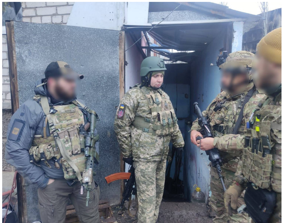
Der Chef des Verteidigungsnachrichtendienstes der Ukraine, Kyrylo Budanow, besucht die vorgeschobenen Stellungen der ukrainischen Streitkräfte in Bakhmut, 28.12.2022