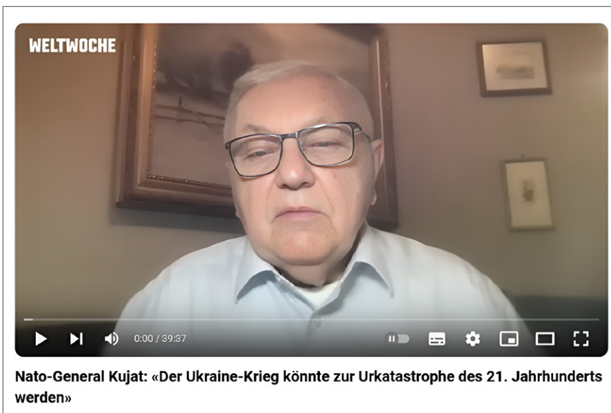
erstellt am 21.6.2024 - 14:55:15, https://www.youtube.com/watch?v=YuMfGaKzQxU