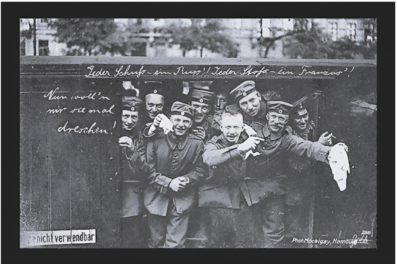
Wohlfahrts-Karte des Vaterländischen Frauenvereins, Provinzialvereins Berlin zum Besten der Kriegsfürsorge, etwa 1914.

Es war noch keine Panik, aber doch eine ständig schwelende Unruhe; immer fühlten wir ein leises Unbehagen, wenn vom Balkan her die Schüsse knatterten. Sollte wirklich der Krieg uns überfallen, ohne dass wir es wussten, warum und wozu? Langsam – allzu langsam, allzu zaghaft, wie wir heute wissen! – sammelten sich die Gegenkräfte. Die Haltung der meisten Intellektuellen war leider eine gleichgültig passive, denn dank