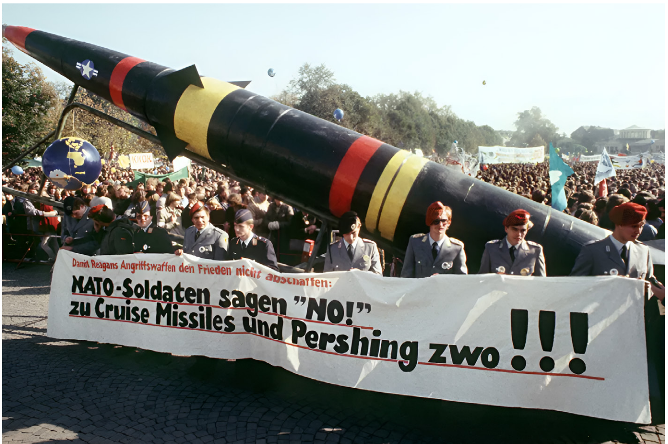
Proteste gegen den Nato-Doppelbeschluss: Tausende demonstrierten 1983 gegen die Stationierung von amerikanischen Raketen vom Typ Pershing 2 in Mutlangen. Sogar Soldaten der Bundeswehr waren mit flotten Sprüchen dabei – in voller Uniform.