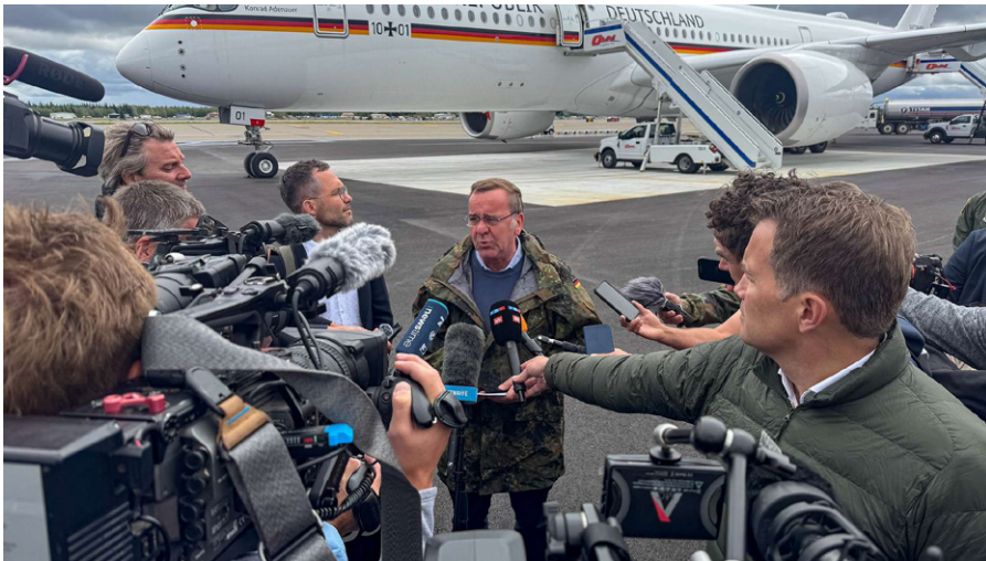
Boris Pistorius am 07.07.2024 auf der Eielson Air Force Base in Alaska. Unter Leitung der Bundeswehr wird dort, bei der Übung Arctic Defender, der Bündnisfall geübt.

zu Russland wirkt auf die Russen wie eine ernsthafte Bedrohung und wird als Angriffsvorbereitung wahrgenommen. Die US-amerikanische Denkfabrik Institute for the Study of War hält es für möglich, dass die Russen der NATO zuvorkommen und Polen oder die baltischen Staaten angreifen könnten. Die Ukraine sei die letzte Verteidigungslinie, bevor es dazu kommt [14]. In russischen Medien werden bereits Atomschläge gegen Polen und sogar gegen die USA gefordert [15]. Sergej Karaganow (Rat für Außen- und Verteidigungspolitik, Ehrenvorsitzender des Präsidiums) forderte schon am 13.06.2023 den Einsatz von Atomwaffen, um die Menschheit zu retten [16]. Während man in Russland von einem NATO-Angriff ausgeht, warnen US-Experten davor, dass sich Russland auf einen großen Konflikt mit der NATO vorbereitet [17].