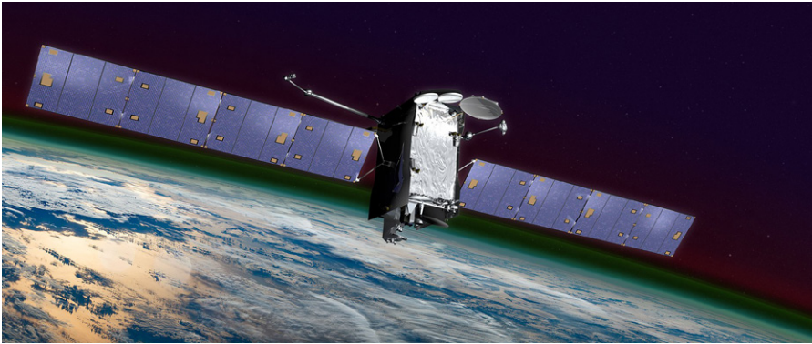
Künstlerische Darstellung von SES-14, einem klassischen Kommunikationssatelliten, 1.2.2018.