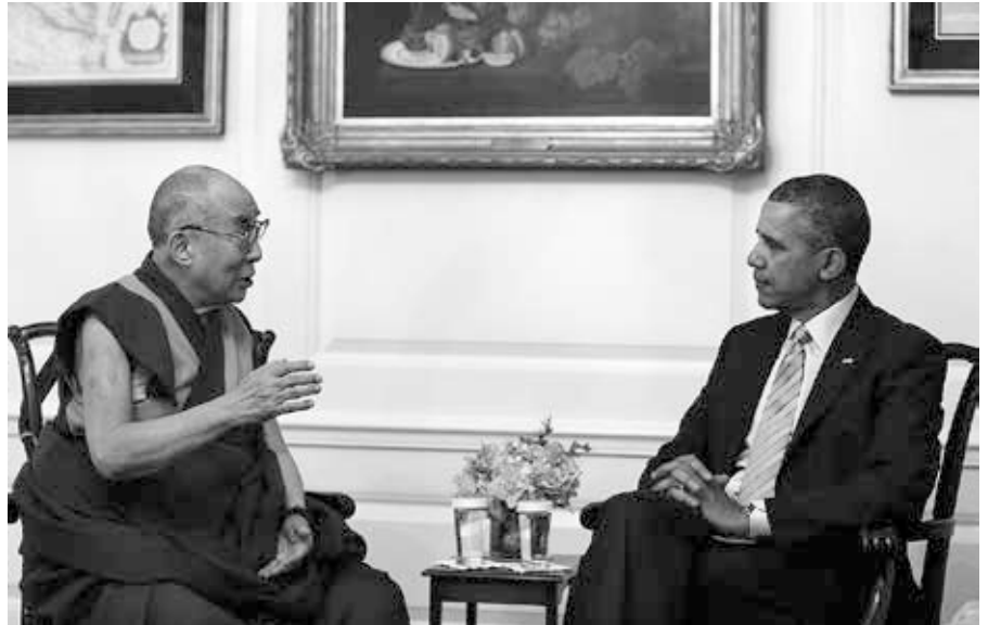
US-Präsident Barack Obama bei einem Treffen mit dem Dalai Lama im Kartenraum des Weißen Hauses am 21. Februar 2014.

Als China und Japan 2009 engere Beziehungen aufbauten, war dies für bestimmte Kräfte in Japan und den USA inakzeptabel. Sie reagierten, indem sie die Territorialkarte spielten, um die Spannung zwischen China und Japan zu erhöhen und sicherzustellen, dass die japanisch-amerikanische Allianz als Japans vorrangige Beziehung beibehalten wurde.