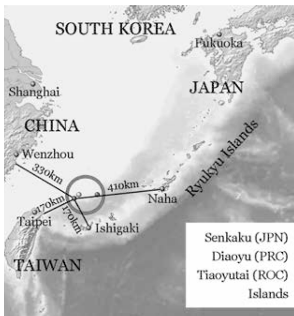
Uotsuri-shima / Diaoyu Dao (Blau), Kuba-shima / Huangwei Yu (Gelb), Taishō-tō / Chiwei Yu (Rot), bezogen auf die Geospatial Information Authority of Japan, und Entfernungen bezogen auf das japanische Außenministerium. Alle Entfernungen auf der Karte zeigen von Küste zu Küste, aber die Entfernungen zwischen der Küste der Insel Okinawa und der Stadt Naha sowie zwischen der Küste der Ishigaki-Insel und der Stadt Ishigaki sind auf der Karte recht nah, erstellt am 13.2.2013.

führt, dass der chinesische Staat eine Einheit mit einem klar definierten Territorium ist. Im Gegensatz zur europäischen Vorstellung vom nationalen Territorium als etwas, das im Laufe der Jahrhunderte durch neue Staaten und neue Grenzen, die durch Kriege bestimmt wurden, konstruiert wurde, wird das chinesische Territorium als feststehend betrachtet. Externe Kräfte haben China erobert und neue Dynastien gegründet, aber das chinesische Territorium war relativ stabil und von der chinesischen Zivilisation geprägt. Bürgerkriege und Angriffe ausländischer Aggressoren konnten diese Wahrnehmung nie ändern. Sowohl Peking als auch Taipeh haben ein gemeinsames Verständnis davon, was „China“ ist, jedoch nicht, wer der legitime Herrscher dieses Landes ist. Das bedeutet, dass das chinesische Territorium, einschließlich seiner historischen Inseln, als „Essenz Chinas“ betrachtet wird – was eine Schwachstelle darstellt, die andere auszunutzen versuchen. Dies wird im Südchinesischen Meer offensichtlich, wo China Riffe in der Nähe der Philippinen und Vietnams beansprucht (analog zur griechischen See-grenze zur Türkei). Der Konflikt um die Diaoyu-/Senkaku-Inseln ist anders. Hier werden Chinas Ansprüche nicht nur durch historische Bindungen motiviert, sondern auch durch die Tatsache, dass die Inseln in der Nähe Taiwans liegen.