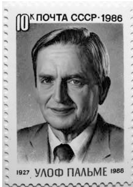
Eine sowjetische Hommage an Olof Palme, hochgeladen am 15.2.2005.