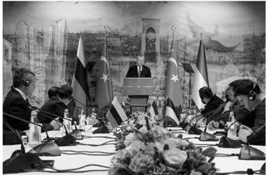
Der türkische Präsident Erdogan spricht im März 2022 kurz vor den Friedensgesprächen zwischen Russland und der Ukraine zu den Verhandlungsführern.