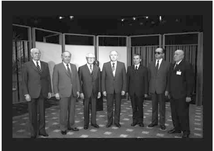
Berlin: Tagung Zum Abschluß stellten sich die Leiter der Delegationen zur turnusmäßigen Tagung des Politischen Beratenden Ausschusses der Teilnehmerstaaten des Warschauer Vertrages den Fotografen. v.l.n.r.: Gustáv Husak (CSSR), Todor Shiwkow (VRB), Erich Honecker (DDR), Michail Gorbatschow (UdSSR), Nicolae Ceausescu (SRR), Wojciech Jaruzelski (VRP) und János Kádár (UVR), 29.5.1987.

Während amerikanische Sicherheitsanalysten in Begriffen wie „Abschreckung“, „Eindämmung“ und „Roll-Back“ denken, ist das Denken russischer Analysten von „Pufferzonen“ geprägt und davon, notfalls hart zuzuschlagen. Man denkt an eine notwendige Verteidigungstiefe zum Schutz der vitalen Interessen Russlands. Dieses russische Denken wurde durch jahrhundertelange westliche Angriffe auf Russland geprägt, von Karl XII. im 18. Jahrhundert über Napoleon im 19. bis hin zu Nazi-Deutschland im 20. Jahrhundert, die alle