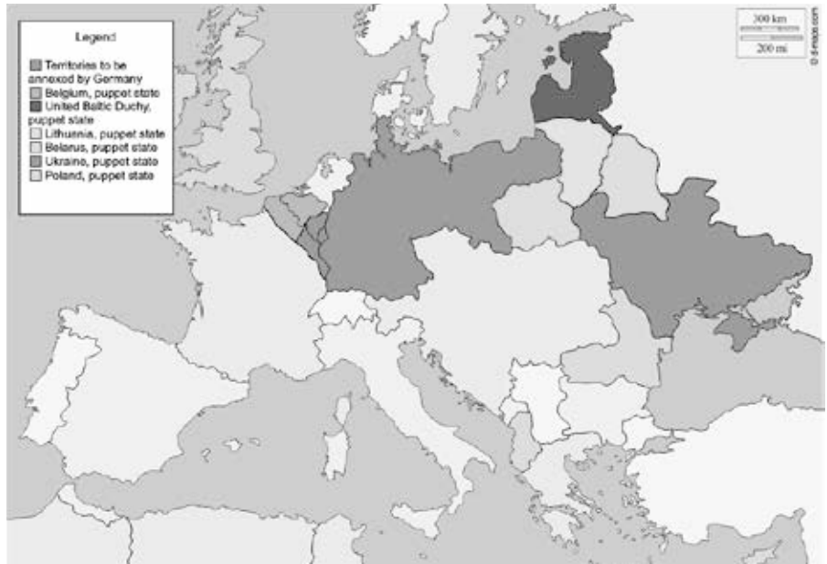
Ein mögliches Ergebnis des deutschen Septemberprogramms in Europa, wenn Deutschland einen schnellen Sieg errungen hätte und es in die Tat umgesetzt worden wäre, erstellt am 20.4.2020.

Zusammenfassend betont Münkler, der Krieg hätte bei mehr politischer Weitsicht und Urteilskraft vermieden werden können. Ein Zusammenspiel von Angst und Unbedarftheit, Hochmut und grenzenlosem Selbstvertrauen habe auf einen Weg geführt, „auf dem schließlich keine Umkehr mehr möglich schien: Ende Juli 1914 nicht, als dies noch relativ einfach gewesen wäre, aber alle Seiten den damit verbundenen ‚Gesichtsverlust‘ scheuten, und auch nicht während des Krieges, als längst klar war, dass jeder weitere Schritt irreparable Verheerungen nicht nur beim Gegner, sondern auch in der eigenen Gesellschaft hinterlassen würde.“ Deutschland, das vier Jahre später den Krieg mit