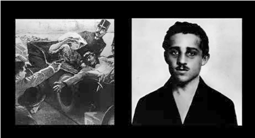
1. Gavrilo Princip erschießt Erzherzog Franz Ferdinand und dessen Frau. Darstellung eines unbekanntes österreichischen Zeitungszeichners aus dem Jahr 1914. 2. Gavrilo Princip während der Haft in Theresienstadt, zwischen 1914 und 1918.

te sie alle in den Wind geschlagen. Der Besuch Sarajewos sollte seinem Entschluss zufolge genau an jenem 28. Juni stattfinden. In seinem Roman „Die Schüsse von Sarajewo“ kommentiert der österreichisch-serbische Schriftsteller Milo Dor das Verhalten des designierten Habsburger Thronfolgers: „Entweder war er stur, oder er hatte kein Taktgefühl. Wahrscheinlich traf beides zu. Er wusste nur zu gut, was für eine Stimmung in Bosnien herrschte.“