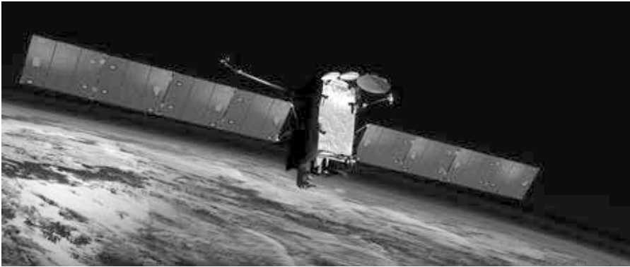
Künstlerische Darstellung von SES-14, einem klassischen Kommunikationssatelliten, 1.2.2018.