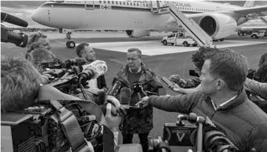
Boris Pistorius am 07.07.2024 auf der Eielson Air Force Base in Alaska. Unter Leitung der Bundeswehr wird dort, bei der Übung Arctic Defender, der Bündnisfall geübt.

zu Russland wirkt auf die Russen wie eine ernsthafte Bedrohung und wird als Angriffsvorbereitung wahrgenommen. Die US-amerikanische Denkfabrik Institute for the Study of War hält es für möglich, dass die Russen der NATO zuvorkommen und Polen oder die baltischen Staaten angreifen könnten. Die Ukraine sei die letzte Verteidigungslinie, bevor es dazu kommt [14]. In russischen Medien werden bereits Atomschläge gegen Polen und sogar gegen die USA gefordert [15]. Sergej Karaganow (Rat für Außen- und Verteidigungspolitik, Ehrenvorsitzender des Präsidiums) forderte schon am 13.06.2023 den Einsatz von Atomwaffen, um die Menschheit zu retten [16]. Während man in Russland von einem NATO-Angriff ausgeht, warnen US-Experten davor, dass sich Russland auf einen großen Konflikt mit der NATO vorbereitet [17].