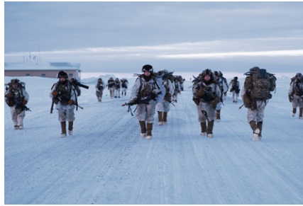
Soldaten der 1st Infantry Brigade Combat Team und der 11th Airborne Division auf dem Weg zu ihrem Übungsziel außerhalb von Utqiagvik, Alaska. Teil der Übung: Joint Pacific Multinational Readiness Training, am 15.02.2024.

Auf der Clear Space Force Station in Alaska befindet sich das Long Range Discrimination Radar, welches speziell den Zweck hat, nach ballistischen Raketen zu suchen. Sobald das Radar eine anfliegende Rakete entdeckt, kommen die Abfangraketen in Fort Greely, Alaska, ins Spiel. Dieser Stützpunkt gehört zum U.S. Army Space and Missile Defense Command. Hier lagern 40 der 44 Abfangraketen, die die Vereinigten Staaten besitzen. Die Er-