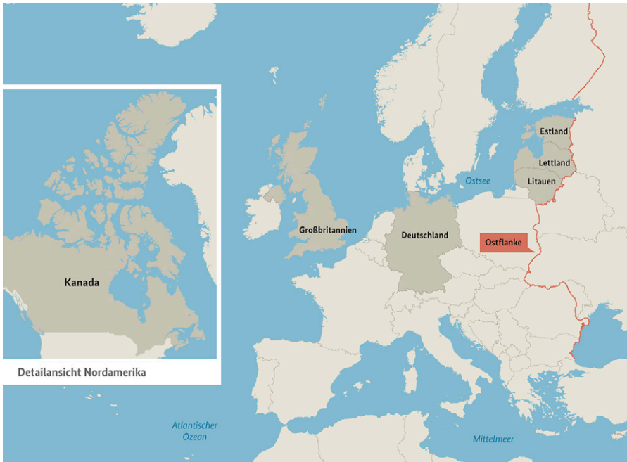
Laut Bundeswehr wird Deutschland an der „Ostflanke“ verteidigt.

treffen. Bei diesem Treffen ging es um die Ukraine und die Arktis. Kanada verpflichtete sich für den „Abwehrkampf der Ukraine mit 52 Millionen Euro“. Eine entscheidende Rolle in der engen Militärkooperation spielt der „Schutz der NATO-Ostflanke“ [24]. Laut Verteidigungsministerium (BMVg) hat die „NATO adäquate Beschlüsse“ zum Schutz der NATO-Ostflanke beschlossen. Diese sehen folgendes vor: