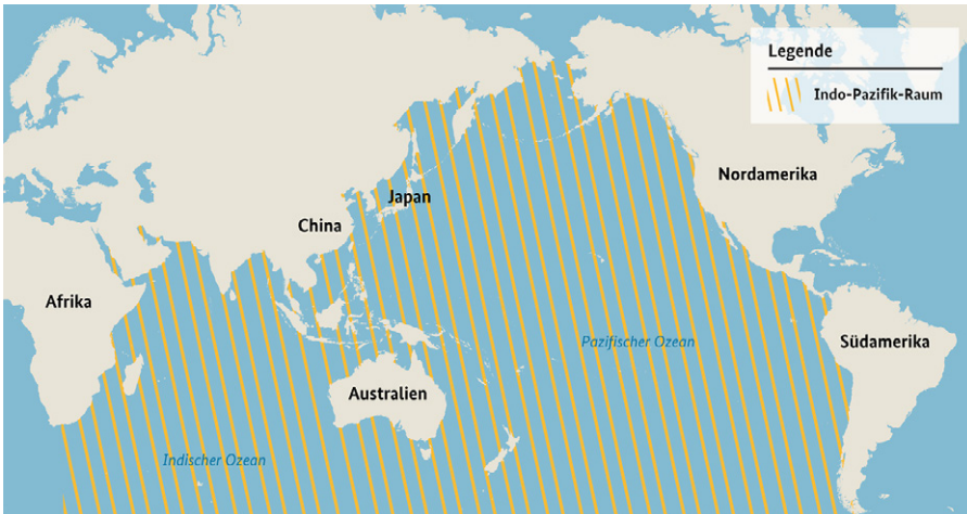
Karte des indo-pazifischen Raums. Stand Juli 2022.