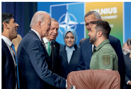
US Präsident Joe Biden begrüßt Volodymyr Zelenskyy beim NATO Summit in Vilnius, Litauen, 12.7.2023

den Mehrheit von 153 Stimmen unterlag [6]. Neben den USA und Israel stimmten nur acht weitere Staaten dagegen und lediglich 23 enthielten sich der Stimme. In vielen Fragen ist die Mehrheit der Weltbevölkerung gegen die USA [7].