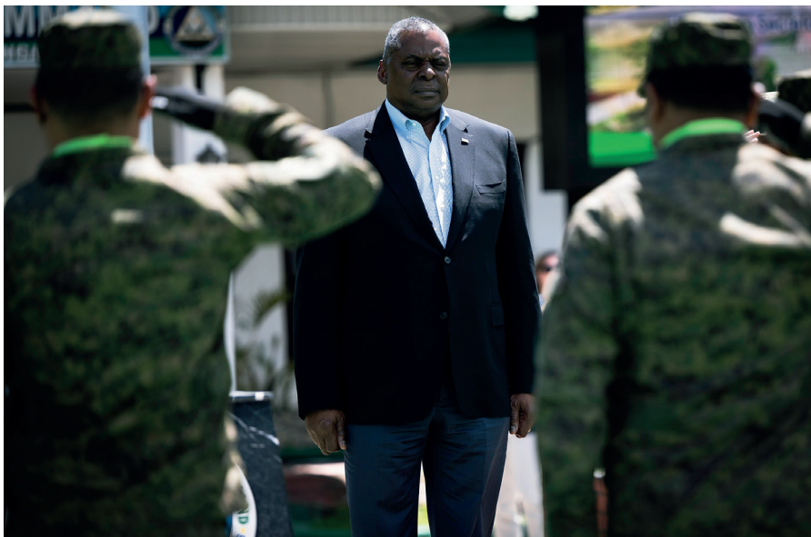
US Verteidigungsminister Lloyd Austin besucht Zamboanga, Philippinen, 1. Februar 2023.

„... Aktivisten sagen, sie beunruhigen die Tatsache, dass die philippinischen Arbeiter, die die Vereinigten Staaten auf den Stützpunkten Clark und Subic Bay beschäftigten, mit Ausbeutung und