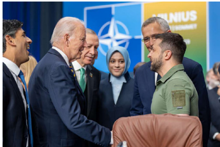
US Präsident Joe Biden begrüßt Volodymyr Zelenskyy beim NATO Summit in Vilnius, Litauen, 12.7.2023

den Mehrheit von 153 Stimmen unterlag [6]. Neben den USA und Israel stimmten nur acht weitere Staaten dagegen und lediglich 23 enthielten sich der Stimme. In vielen Fragen ist die Mehrheit der Weltbevölkerung gegen die USA [7].