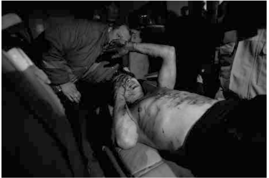
Freiwillige der ukrainischen Rotkreuzgesellschaft leisten einem verwundeten Demonstranten erste Hilfe. Euromaidan-Proteste, 19.1.2014.

Juschtschenkos frühere Ministerpräsidentin Julia Timoschenko hatte ebenfalls Verbindungen zur extremen Rechten. Ab Ende 2013 wurde – von der Verliererseite der 2010er-Wahlen – zu Massendemonstrationen in den von Timoschenko dominierten Gebieten (siehe unten) mobilisiert. Ab Februar 2014 wurden diese Demonstrationen zunehmend gewalttätig. Sie wur-