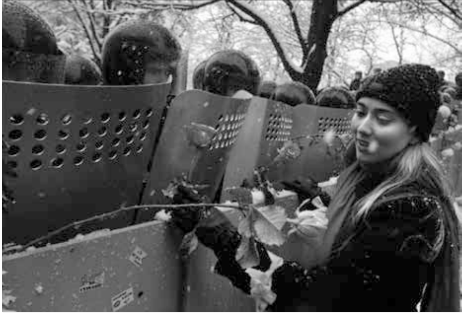
Eine junge Frau heftet während der Orangen Revolution in Kiew Blumen an die Schilde von Bereitschaftspolizisten, 1.12.2004.