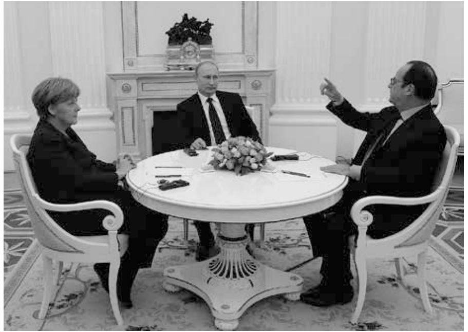
Bundeskanzlerin Angela Merkel, Russlands Präsident Wladimir Putin und Frankreichs Präsident François Hollande im Kreml, um Lösungen für die Situation im Südosten der Ukraine zu erörtern, 6.2.2015.

Während die USA ein Argument für den Kosovo und ein anderes für Donezk und Lugansk anführten, wollte Wladimir Putin möglicherweise auf die Heuchelei des Westens hinweisen. Die westlichen Länder hatten ihren eigenen Angriff auf Serbien im Jahr 1999 nicht verurteilt und ihre Anerkennung des Kosovo hätte daher eine ähnliche Anerkennung von Donezk und Lugansk ermöglichen müssen. Im Gegensatz zu der geringen Anzahl von Menschen, die 1999 bei den Kämpfen in Račak getötet wurden (laut Zeugenaussagen von Le Monde [42] hat es dort nie ein Massaker gegeben [43]), und der begrenzten Anzahl von Albanern, die vor dem Krieg getötet wurden, konnte Russland auf die Tötung tausender Zivilisten in Donezk und Lugansk verweisen. Und, was vielleicht noch wichtiger ist, auf die Tatsache, dass die Ukraine offensichtlich gegen ein internationales Abkommen (das Minsker Abkommen) verstoßen hat.