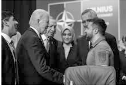
US Präsident Joe Biden begrüßt Volodymyr Zelenskyy beim NATO Summit in Vilnius, Litauen, 12.7.2023

den Mehrheit von 153 Stimmen unterlag [6]. Neben den USA und Israel stimmten nur acht weitere Staaten dagegen und lediglich 23 enthielten sich der Stimme. In vielen Fragen ist die Mehrheit der Weltbevölkerung gegen die USA [7].