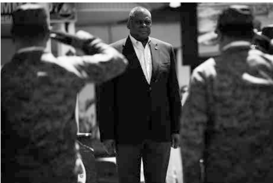
US Verteidigungsminister Lloyd Austin besucht Zamboanga, Philippinen, 1. Februar 2023.

„...Aktivisten sagen, sie beunruhigen die Tatsache, dass die philippinischen Arbeiter, die die Vereinigten Staaten auf den Stützpunkten Clark und Subic Bay beschäftigen, mit Ausbeutung und