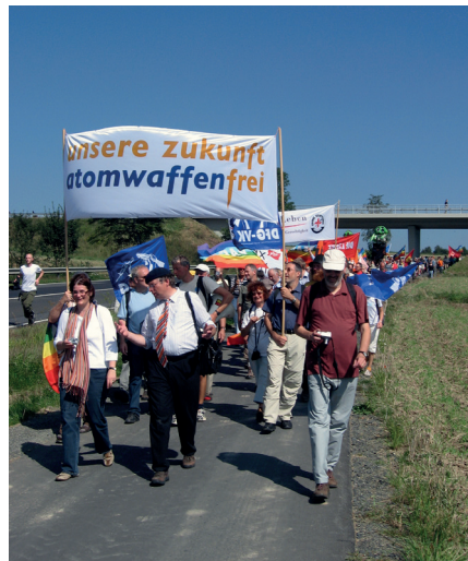
Demonstration gegen Atomwaffen in Deutschland am Fliegerhorst Büchel, 30. August 2008, etwa 2000 Teilnehmer. Gemeinfrei.

rikaner zahlen dem Konsortium Lockheed pro Blechvogel gerade einmal 75 Millionen Dollar [7]. Es ist nicht nachvollziehbar, warum der deutsche Steuerzahler für dasselbe Flugzeug etwa dreieinhalb mal mehr bezahlen soll als die US-Amerikaner. Die deutschen Politiker als Hans im Glück? Mittlerweile haben die Amerikaner als kleine Kompensation für diesen obszönen Wucherpreis die Deutschen als Subunternehmer mit ins Boot genommen. Denn jetzt darf der deutsche Rüstungskonzern Rheinmetall gewisse Rumpfteile des Tarnkappenjets F-35 in einer neuen Fertigungshalle im nordrhein-westfälischen Weeze anfertigen [8]. Zunächst war Sachsen vorgesehen als Standort für die neue Rheinmetall-Fabrik [9].