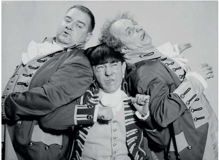
Die Komikergruppe „The Three Stooges“.

Dieser Text wurde zuerst am 15.03.2024 auf www.strategic-culture.su unter der URL https://www.strategic-culture.su/news/2024/03/15/the-german-american-strategic-depth-clown-show veröffentlicht. Lizenz: Pepe Escobar, Strategic Culture, CC BY-NC-ND 4.0