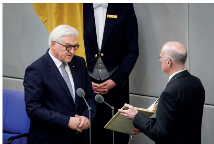
Frank-Walter Steinmeier bei der Vereidigung vor dem Deutschen Bundestag mit dem Präsidenten des Deutschen Bundestages Norbert Lammert

Das alles ist dem Bundespräsidenten Steinmeier bekannt. Bisher enthielt er sich jeder Stellungnahme zu den die Sicherheit der Bundesrepublik gefährdenden Angriffsplänen. Dabei hat er bei Amtsantritt vor den versammelten Mitgliedern des Bundestages und des Bundesrates folgenden Eid abgelegt: