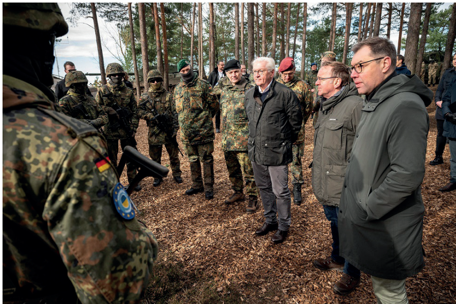
Bundespräsident Frank-Walter Steinmeier, Verteidigungsminister Boris Pistorius und der ukrainische Botschafter Oleksii Makeiev im Ausbildungszentrum Nord in Klietz im Elb-Havel-Winkel.

Ende April 2000 folgte der Bundestagsabgeordnete Willy Wimmer der Einladung des US-Außenministeriums und des „American Enterprise Institute“ zu einer Konferenz nach Bratislava. Hier wurde Klartext über die amerikanischen Pläne für die Neuordnung Europas gesprochen. Das veranlasste Wimmer, am 2. Mai 2000 Bundeskanzler Gerhard Schröder in einem Brief über die Inhalte dieser Konferenz zu informieren. An erster Stelle wurde verlangt, im Kreis der Alliierten die möglichst baldige völkerrechtliche Anerkennung eines unabhängigen Staates Kosovo vorzunehmen. [14]