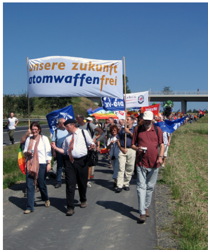
Demonstration gegen Atomwaffen in Deutschland am Fliegerhorst Büchel, 30. August 2008, etwa 2000 Teilnehmer. Gemeinfrei.

rikaner zahlen dem Konsortium Lockheed pro Blechvogel gerade einmal 75 Millionen Dollar [7]. Es ist nicht nachvollziehbar, warum der deutsche Steuerzahler für dasselbe Flugzeug etwa dreieinhalb mal mehr bezahlen soll als die US-Amerikaner. Die deutschen Politiker als Hans im Glück? Mittlerweile haben die Amerikaner als kleine Kompensation für diesen obszönen Wucherpreis die Deutschen als Subunternehmer mit ins Boot genommen. Denn jetzt darf der deutsche Rüstungskonzern Rheinmetall gewisse Rumpfteile des Tarnkappenjets F-35 in einer neuen Fertigungshalle im nordrhein-westfälischen Weeze anfertigen [8]. Zunächst war Sachsen vorgesehen als Standort für die neue Rheinmetall-Fabrik [9].