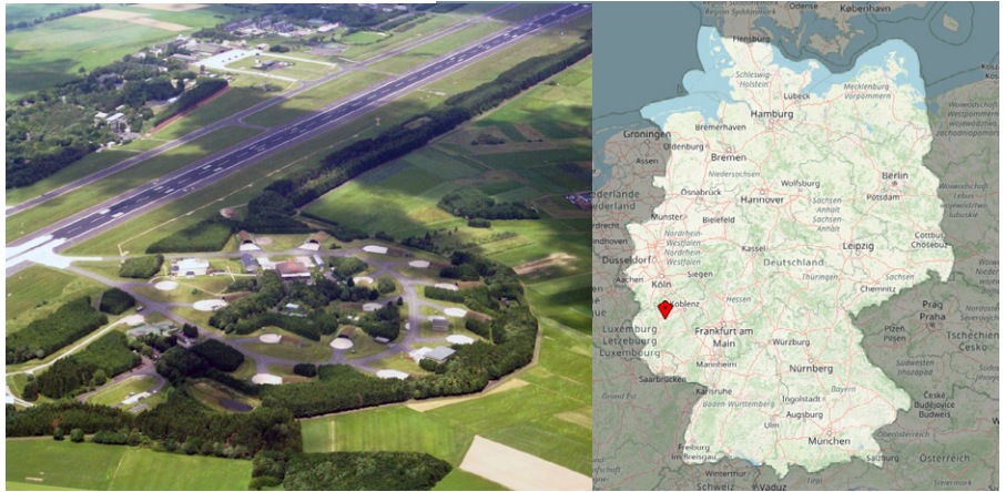
Luftaufnahme des Fliegerhorsts Büchel (links; Lizenz: Wikimedia Commons, User Stahlkocher, CC BY-SA 3.0) und Deutschlandkarte mit der Position des Fliegerhorsts (rechts; gemeinfrei)

Und um diese von Gerhartz und seinen Freunden so begehrte „nukleare Teilhabe“ auch dauerhaft behalten zu dürfen, muss Deutschland den Nachweis führen, über geeignete Träger-Flugzeuge zu verfügen, die eine zielgenaue Platzierung der Atombomben im Feindesland auch gewährleisten. Bis jetzt erfüllen diese anspruchsvolle Aufgabe Flugzeuge der Marke Panavia