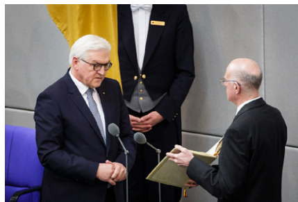
Frank-Walter Steinmeier bei der Vereidigung vor dem Deutschen Bundestag mit dem Präsidenten des Deutschen Bundestages Norbert Lammert

Das alles ist dem Bundespräsidenten Steinmeier bekannt. Bisher enthielt er sich jeder Stellungnahme zu den die Sicherheit der Bundesrepublik gefährdenden Angriffsplänen. Dabei hat er bei Amtsantritt vor den versammelten Mitgliedern des Bundestages und des Bundesrates folgenden Eid abgelegt: