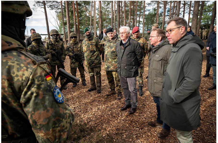
Bundespräsident Frank-Walter Steinmeier, Verteidigungsminister Boris Pistorius und der ukrainische Botschafter Oleksii Makeiev im Ausbildungszentrum Nord in Klietz im Elb-Havel-Winkel.

Ende April 2000 folgte der Bundestagsabgeordnete Willy Wimmer der Einladung des US-Außenministeriums und des „American Enterprise Institute“ zu einer Konferenz nach Bratislava. Hier wurde Klartext über die amerikanischen Pläne für die Neuordnung Europas gesprochen. Das veranlasste Wimmer, am 2. Mai 2000 Bundeskanzler Gerhard Schröder in einem Brief über die Inhalte dieser Konferenz zu informieren. An erster Stelle wurde verlangt, im Kreis der Alliierten die möglichst baldige völkerrechtliche Anerkennung eines unabhängigen Staates Kosovo vorzunehmen. [14]