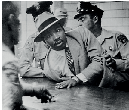
Verhaftung von Dr. Martin Luther King Jr., 1958 in Montgomery, Alabama, wegen "Herumlungens", 4.9.1958.

kommen, weil wir dies als eine dunkle Stunde für die Menschheit erkennen. Für die meisten von uns ist dies eine neue Haltung. Wir sind traditionell die Idealisten. Wir sind die Demonstranten aus Mississippi und Selma und Washington, die in der ersten Hälfte dieses Jahrzehnts ihr Leben für den amerikanischen Traum eingesetzt haben. Viele der hier Versammelten haben sich 1964 leidenschaftlich für Lyndon Johnson eingesetzt, weil wir nicht tatenlos zusehen konnten, wie unsere Nation durch die Politik des Goldwaterismus aus dem 18. Jahrhundert vergiftet wird. Wir waren die hartgesottenen Aktivisten, die zu glauben bereit waren, dass die Südstaatler nach dem Vorbild der Verfassung wieder aufgerichtet werden könnten.