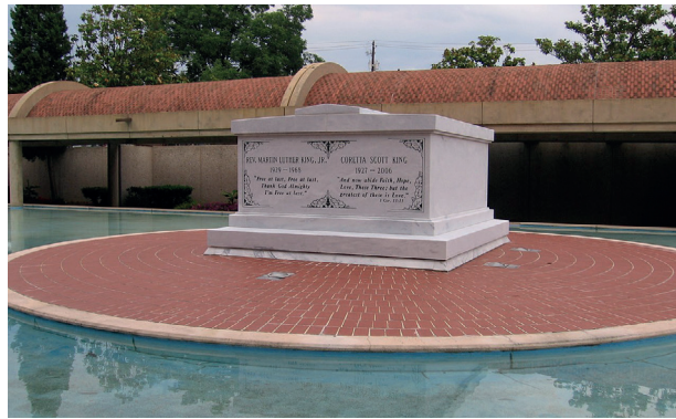
Das Grab von Martin Luther King in Atlanta, Juli 2007.

Wir alle müssen also erkennen, dass wir uns überall auf der Welt in revolutionären Zeiten befinden, dass die Menschen sich gegen die alten Ausbeutungssysteme auflehnen, und dass aus dem Schoß einer schwachen Welt neue Systeme der Gerechtigkeit und Gleichheit geboren werden. Die Zerlumpte und Barfußigen