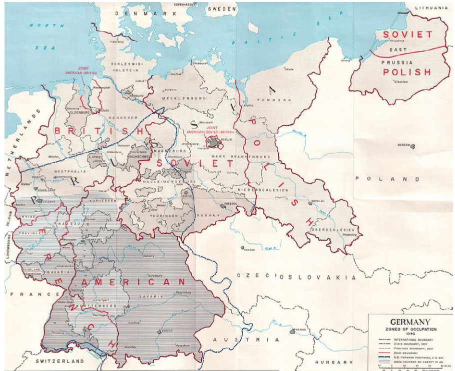
Deutschland Besatzungszonen 1945 Karte der Besatzungszonen Deutschlands im Jahr 1945. Aus Earl F. Ziemke, Die US-Armee in der Besetzung Deutschlands , 1975. (Public Domain)

Drei Monate später, auf dem Zweiten Parteitag im Juli 1952, erklärte die SED, die DDR werde „zum Aufbau des Sozialismus übergehen“ [43]. Zentraler Punkt der Erklärung war die schrittweise Bildung von Landwirtschaftlichen Produktionsgenossenschaften (LPG) [44]. Die Industrie, die bereits seit einigen Jahren unter provisorischer Wirtschaftsplanung arbeitete, sollte nun weiter zentralisiert werden. Kleine und mittlere Privatunternehmen spielten jedoch in den nächsten