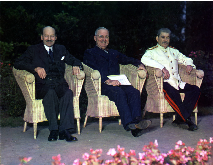
Clement Attlee, Harry S. Truman, und Joseph Stalin, auf der Potsdamer Konferenz, 1. August 1945. (gemeinfrei)

Das Ende des Jahres 1947 und die erste Hälfte des Jahres 1948 markierten einen Wendepunkt. Als Reaktion auf die sich verschlechternde internationale Lage gründete die Kommunistische Partei der Sowjetunion im Oktober 1947 das Kominform. Es sollte als inoffizielle europäische Nachfolgeorganisation der Komintern fungieren, die 1943 aufgelöst worden war, um den Zusammenhalt in der Anti-Hitler-Koalition zu wahren. Eine stärkere politische Einheit der europäischen kommunistischen Parteien sollte die Antwort auf die Truman-Doktrin sein. Die SED, die zwar nicht Mitglied des Kominforms war, orientierte sich ab 1948 trotzdem an leninistischen