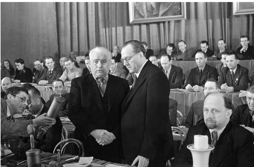
Vereinigungsparteitag von KPD und SPD zur SED 1946 mit dem historischen Händedruck zwischen Otto Grotewohl und Wilhelm Pieck.

In den westlichen Besatzungszonen verlief die Entwicklung ganz anders. Wie in der SBZ herrschte auch in Westdeutschland ein breiter Konsens zwischen verschiedenen Gruppen und Parteien, dass die kapitalistische Wirtschaftsordnung ihre Berechtigung und Glaubwürdigkeit verloren hatte. Mehr als ein Jahrzehnt faschistischer Herrschaft und die Zerstörungen durch den Krieg hatten dies deutlich gemacht. Rufe nach der Vergesellschaftung von Schlüsselindustrien und der Beseitigung des Monopolkapitals waren nicht nur von Kommunisten, Sozialdemokraten und Gewerkschaftern zu hören – selbst die konservative CDU hatte sich in ihrem „Ahlener Programm“ von 1947 vom Kapitalismus losgesagt und einen „christlichen Sozialismus“ propagiert. Trotz dieser Überzeugungen begannen die westlichen Militärverwaltungen schon bald, die im Potsdamer Abkommen vorgesehenen Initiativen zur Vergesellschaftung und zur Bodenreform zu behindern [21]. Auch Versuche, eine einheitliche branchenübergreifende Gewerkschaft