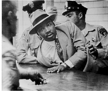
Verhaftung von Dr. Martin Luther King Jr., 1958 in Montgomery, Alabama, wegen "Herumlungerns", 4.9.1958.

kommen, weil wir dies als eine dunkle Stunde für die Menschheit erkennen. Für die meisten von uns ist dies eine neue Haltung. Wir sind traditionell die Idealisten. Wir sind die Demonstranten aus Mississippi und Selma und Washington, die in der ersten Hälfte dieses Jahrzehnts ihr Leben für den amerikanischen Traum eingesetzt haben. Viele der hier Versammelten haben sich 1964 leidenschaftlich für Lyndon Johnson eingesetzt, weil wir nicht tatenlos zusehen konnten, wie unsere Nation durch die Politik des Goldwaterismus aus dem 18. Jahrhundert vergiftet wird. Wir waren die hartgesottenen Aktivisten, die zu glauben bereit waren, dass die Südstaatler nach dem Vorbild der Verfassung wieder aufgerichtet werden könnten.