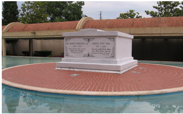
Das Grab von Martin Luther King in Atlanta, Juli 2007.

Wir alle müssen also erkennen, dass wir uns überall auf der Welt in revolutionären Zeiten befinden, dass die Menschen sich gegen die alten Ausbeutungssysteme auflehnen, und dass aus dem Schoß einer schwachen Welt neue Systeme der Gerechtigkeit und Gleichheit geboren werden. Die Zerlumpten und Barfüßigen