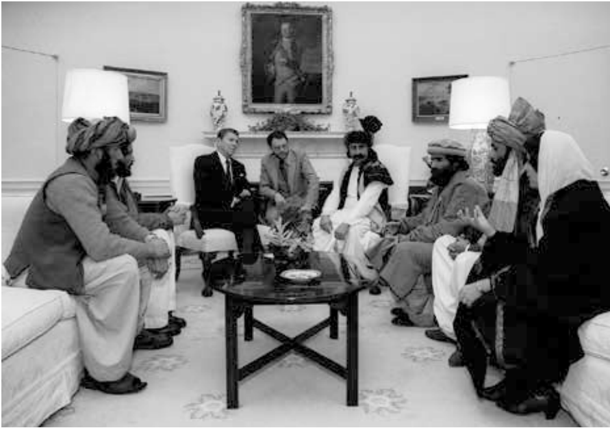
Präsident Reagan trifft sich mit afghanischen Mudschahedin im Weißen Haus, um die sowjetische Invasion in Afghanistan zu besprechen, 2.2.1983.