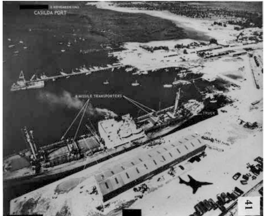
Sowjetisches Personal und sechs Raketentransporter, die am Hafen von Casilda in Kuba auf einen Schiffstransport geladen werden, auf diesem Foto vom 6. November 1962, das von einer RF-101 Voodoo der Luftwaffe aufgenommen wurde. Man beachte die Silhouette des Flugzeugs in der unteren rechten Ecke.