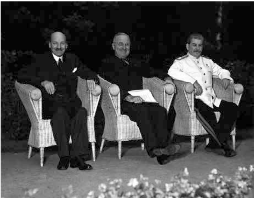
Clement Attlee, Harry S. Truman, und Joseph Stalin, auf der Potsdamer Konferenz, 1. August 1945.

Das Ende des Jahres 1947 und die erste Hälfte des Jahres 1948 markierten einen Wendepunkt. Als Reaktion auf die sich verschlechternde internationale Lage gründete die Kommunistische Partei der Sowjetunion im Oktober 1947 das Kominform. Es sollte als inoffizielle europäische Nachfolgeorganisation der Komintern fungieren, die 1943 aufgelöst worden war, um den Zusammenhalt in der Anti-Hitler-Koalition zu wahren. Eine stärkere politische Einheit der europäischen kommunistischen Parteien sollte die Antwort auf die Truman-Doktrin sein. Die SED, die zwar nicht Mitglied des Kominforms war, orientierte sich ab 1948 trotzdem an leninistischen