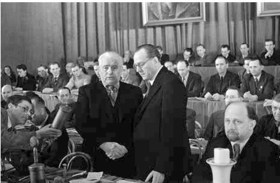
Vereinigungsparteitag von KPD und SPD zur SED 1946 mit dem historischen Händedruck zwischen Otto Grotewohl und Wilhelm Pieck.

In den westlichen Besatzungszonen verlief die Entwicklung ganz anders. Wie in der SBZ herrschte auch in Westdeutschland ein breiter Konsens zwischen verschiedenen Gruppen und Parteien, dass die kapitalistische Wirtschaftsordnung ihre Berechtigung und Glaubwürdigkeit verloren hatte. Mehr als ein Jahrzehnt faschistischer Herrschaft und die Zerstörungen durch den Krieg hatten dies deutlich gemacht. Rufe nach der Vergesellschaftung von Schlüsselindustrien und der Beseitigung des Monopolkapitals waren nicht nur von Kommunisten, Sozialdemokraten und Gewerkschaftern zu hören – selbst die konservative CDU hatte sich in ihrem „Ahlener Programm“ von 1947 vom Kapitalismus losgesagt und einen „christlichen Sozialismus“ propagiert. Trotz dieser Überzeugungen begannen die westlichen Militärverwaltungen schon bald, die im Potsdamer Abkommen vorgesehenen Initiativen zur Vergesellschaftung und zur Bodenreform zu behindern [21]. Auch Versuche, eine einheitliche branchenübergreifende Gewerkschaft