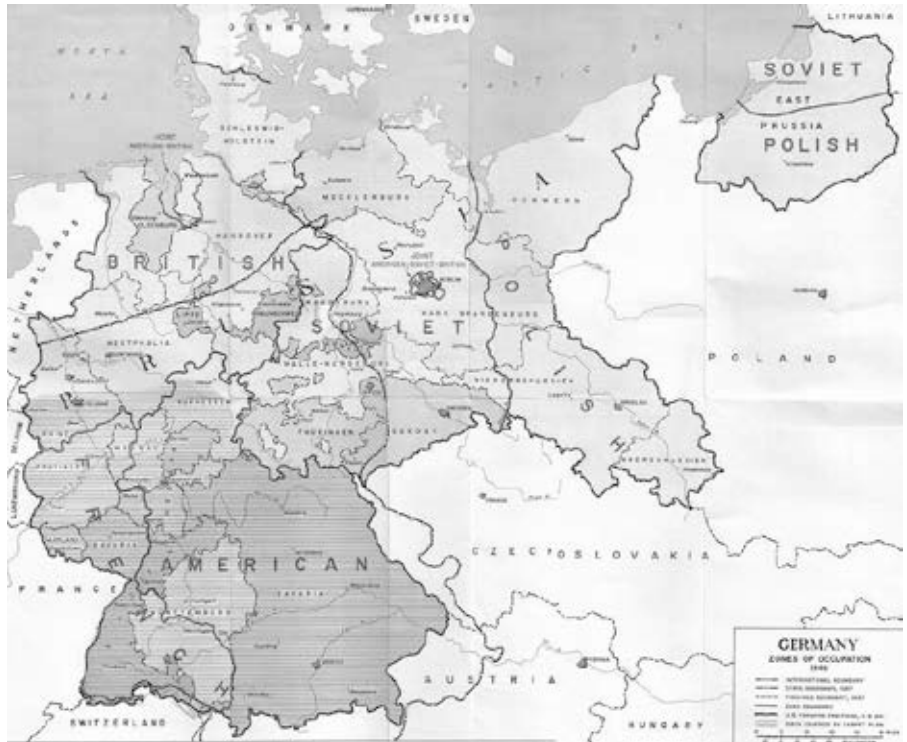
Deutschland Besatzungszonen 1945 Karte der Besatzungszonen Deutschlands im Jahr 1945. Aus Earl F. Ziemke, Die US-Armee in der Besetzung Deutschlands , 1975. (Public Domain)

Drei Monate später, auf dem Zweiten Parteitag im Juli 1952, erklärte die SED, die DDR werde „zum Aufbau des Sozialismus übergehen“ [43]. Zentraler Punkt der Erklärung war die schrittweise Bildung von Landwirtschaftlichen Produktionsgenossenschaften (LPG) [44]. Die Industrie, die bereits seit einigen Jahren unter provisorischer Wirtschaftsplanung arbeitete, sollte nun weiter zentralisiert werden. Kleine und mittlere Privatunternehmen spielten jedoch in den nächsten